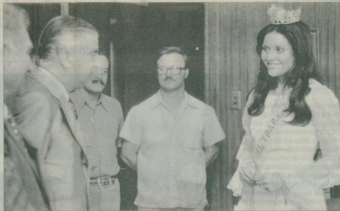
El interventor de la provincia, Antonio Cafiero, saluda a las soberanas en la fiesta de 1975.