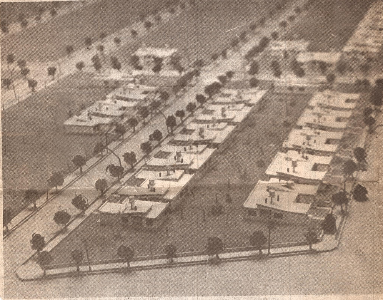
Maqueta del barrio de viviendas individuales "Las Bóvedas" a construirse en Palmira, departamento de San Martín.

terreno, comprendida por el régimen Prog. H.N. 0752. Las diversas modalidades de cada uno de los préstamos en cuanto a montos máximos prestables y sus correspondientes porcentajes se ajustan al tipo de vivienda y a sus características de distribución, superficies financieras y locales que la sitúan como vivienda única y permanente situada en zonas de residencia también permanente.