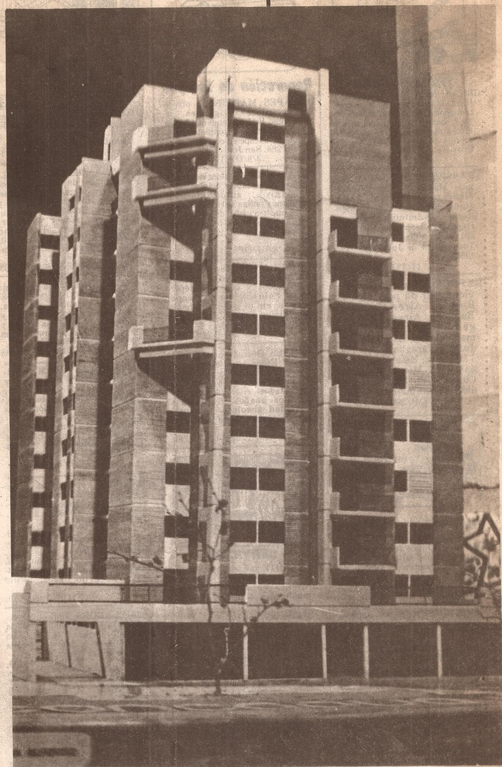
Maqueta del edificio de departamentos a construirse en el radio céntrico de la ciudad de Mendoza.

Cabe agregar que se encuentran asimismo en distinto estado de trámite