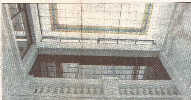
Particolare del lucernario