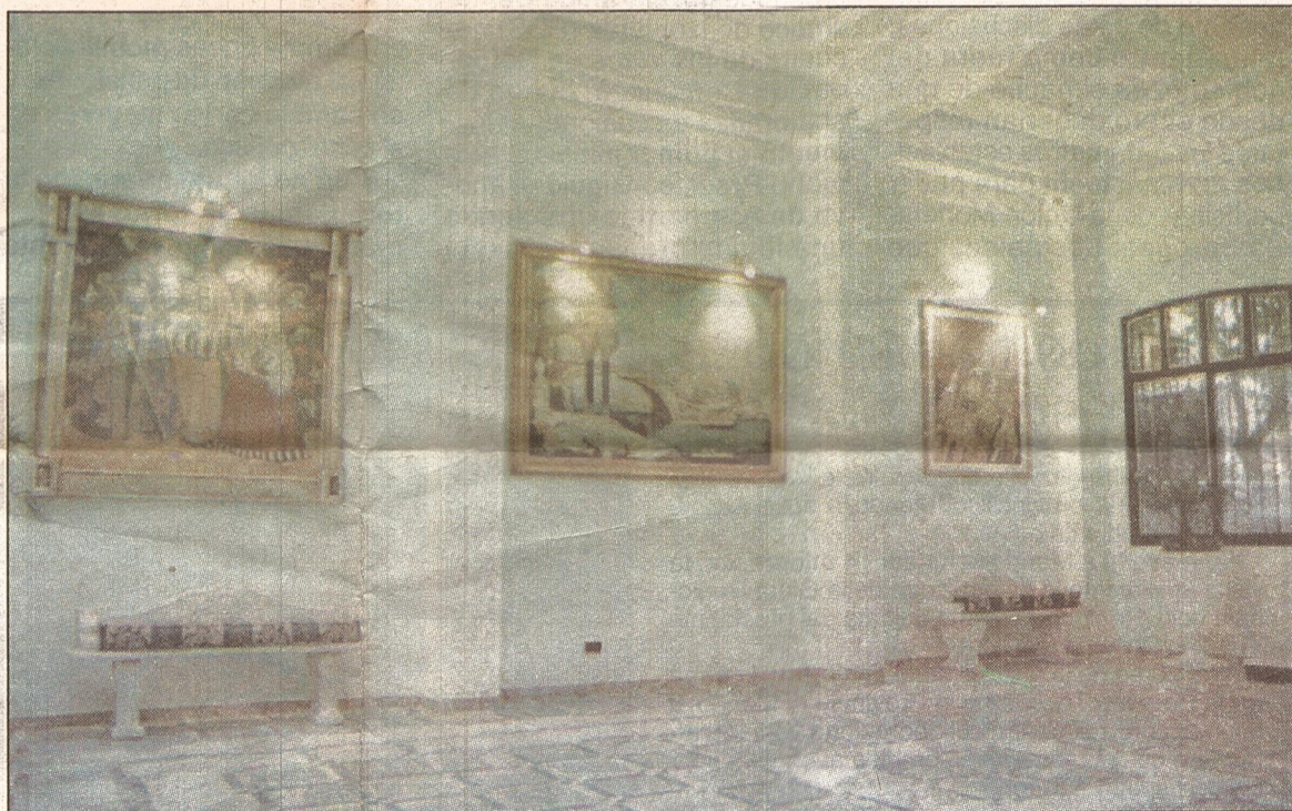
Veduta della nuova sala d'attesa