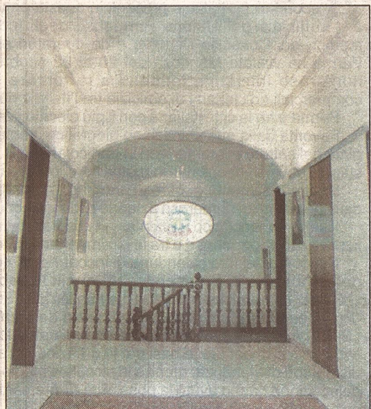
Salone dello stemma, ristrutturato secondo lo stile originario del palazzo