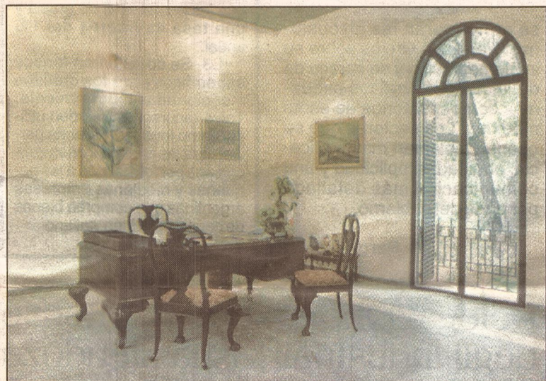
Nuovo ufficio del Console