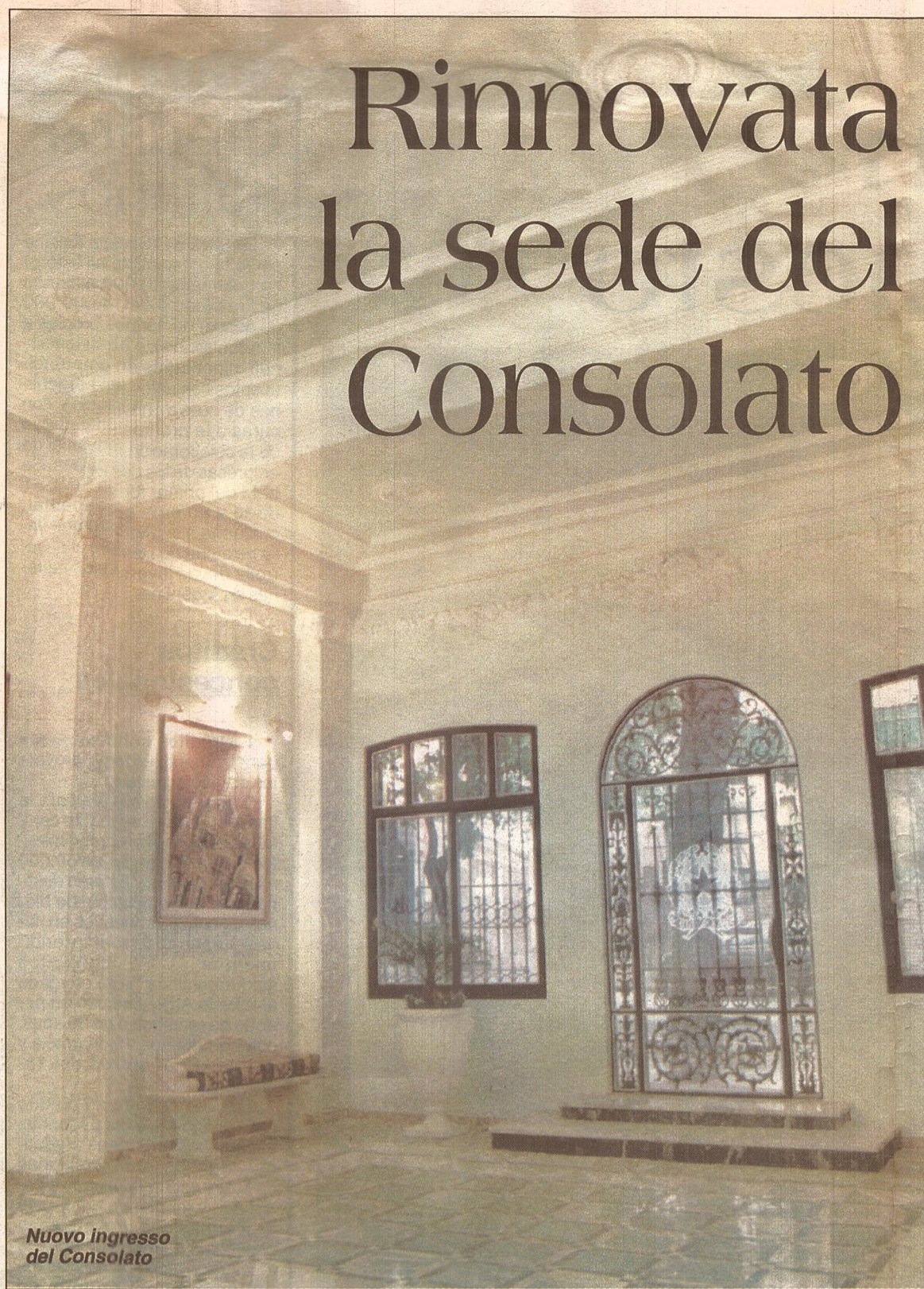
Nuovo ingresso del Consolato