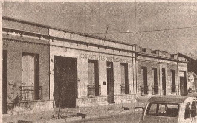
Las construcciones de carácter continuo de altura constante, constituyen la "imagen urbana tradicional" de la ciudad de principio de siglo. La ausencia circunstancial del árbol nos desnuda una arquitectura menor y doméstica que adquiere significado en el conjunto.

vacación urbana suele implicar, por lo menos en proyecto, la desaparición lisa y llana de grandes superficies construidas en aras de una modernización a ultranza, sacrificio hecho a los grandes dioses paganos del rendimiento económico y la espectacularidad tecnológica. Sin duda que no se debe renunciar a la renovación, pero, usando una explicación muy gráfica, debería hacerse "con la mesura con que obra la naturaleza, que renueva continuamente las células de la piel sin que el individuo deje de ser el mismo". Las células muertas, a escala urbana, son sin duda las construcciones en adobe, que por problemas de seguridad sísmica deben desaparecer. Pero ello no debe implicar necesariamente borrar y eliminar la imagen de zonas de la ciudad que se han ido elaborando al compás del tiempo, sin apuros y mansamente, en el que la individualidad del diseño responde en lo general