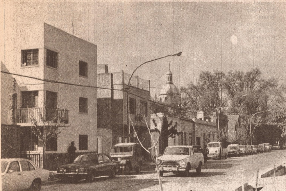
Cuando las nuevas edificaciones no guardan armonía de escala, materiales y tratamiento plástico, el ambiente se "moderniza", es cierto, pero como se ve se empobrece como imagen urbana, pierde el "carácter" que adquirió con el tiempo.

Como ejemplo palpable de la viabilidad y conveniencia de encarar un plan como el especificado, el Arq. Ponte nos ha hecho llegar una síntesis del Plan Regulador de Bolonia, del que se ha realizado ya una gran parte, en los que se aclaran y extienden algunos de los criterios comentados y se agregan nuevos conceptos que refuerzan el esquema teórico. Tal síntesis la haremos conocer en nuestra próxima entrega.