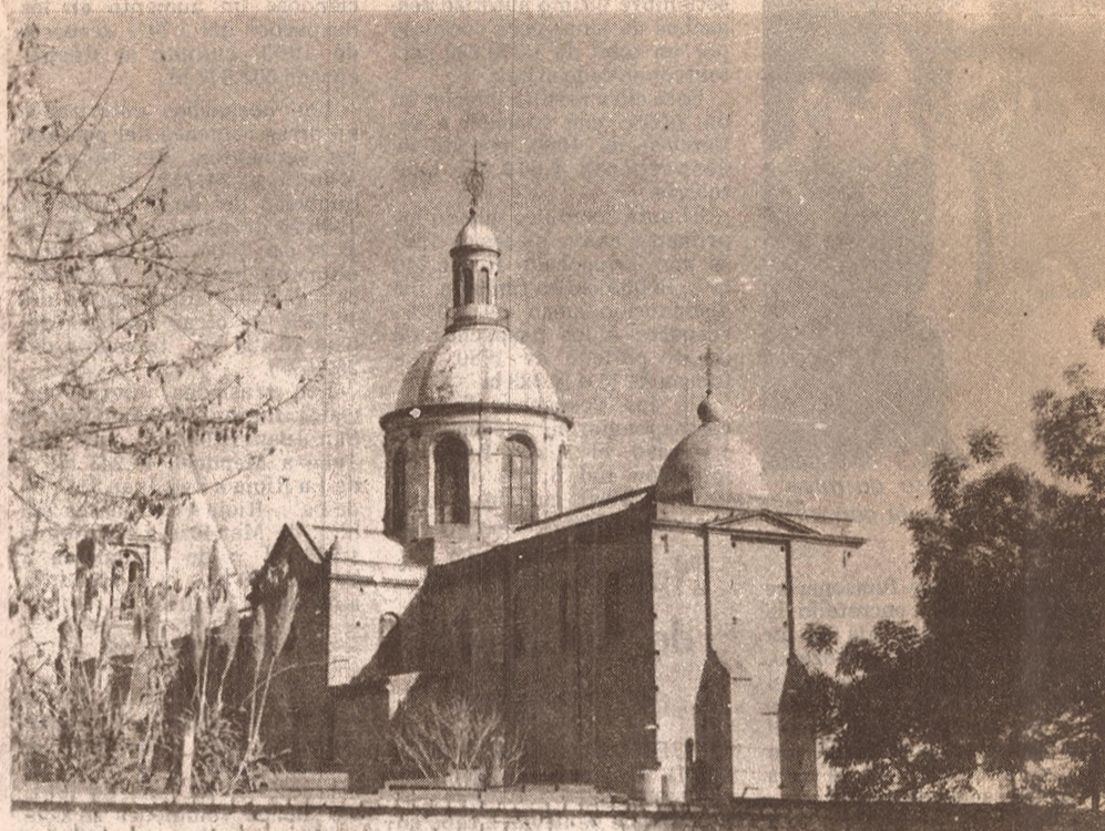
El Código de Edificación, que no diferencia "Áreas a Preservar", permite casi todo en cualquier parte. No reglamenta las necesarias armonías y permite la agresión al entorno a veces histórico.

Quizá el meollo de su posición pueda resumirse en la contraposición de los conceptos de renovación y restauración. El criterio de renovación