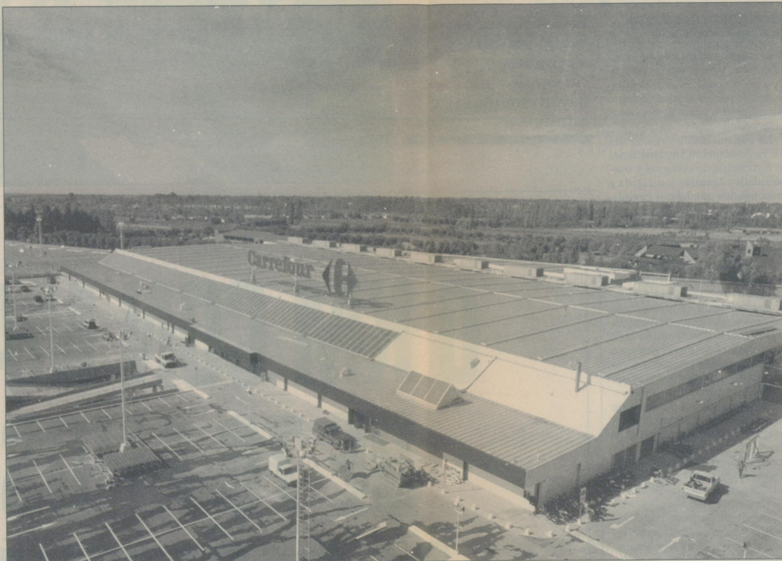
La apertura del hipermercado ha generado notable expectativa en Mendoza.

El hipermercado es el primero en su tipo que se establece en nuestra provincia. Tiene cinco sectores de ventas: almacén, productos frescos, textil, electrodomésticos y bazar