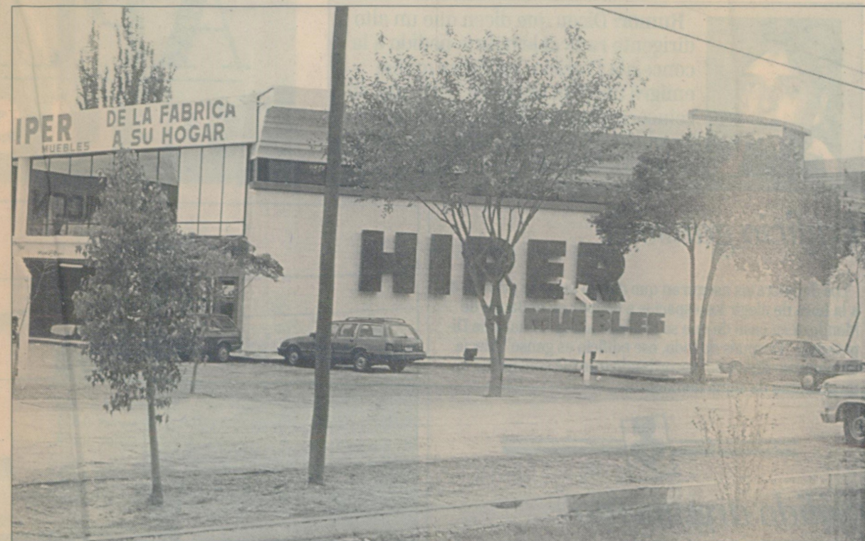
Fachada de la empresa que ocupa una de las naves del complejo Híper inaugurado el viernes.

Híper Muebles se dedica principalmente a la fabricación de muebles para el hogar: dormitorios, comedores, cocinas, placares, incluso petit muebles. Asimismo, a nivel de grandes volúmenes, realizan con diseños especiales, amoblamiento de hoteles,