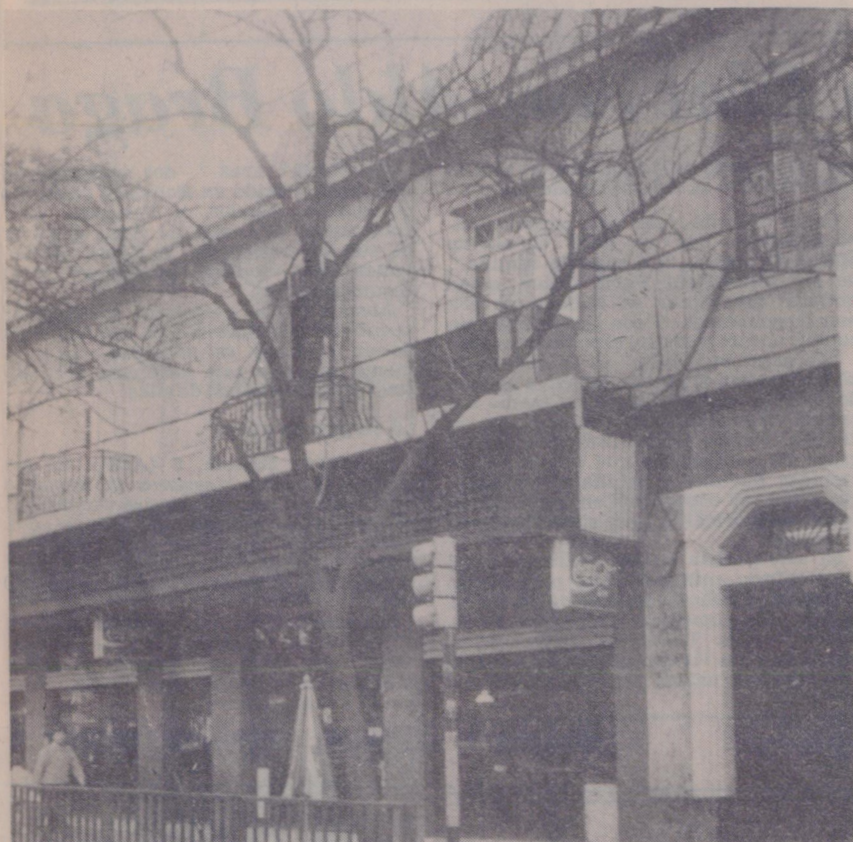
El edificio de Lavalle 8, otro exponente del tradicional estilo.