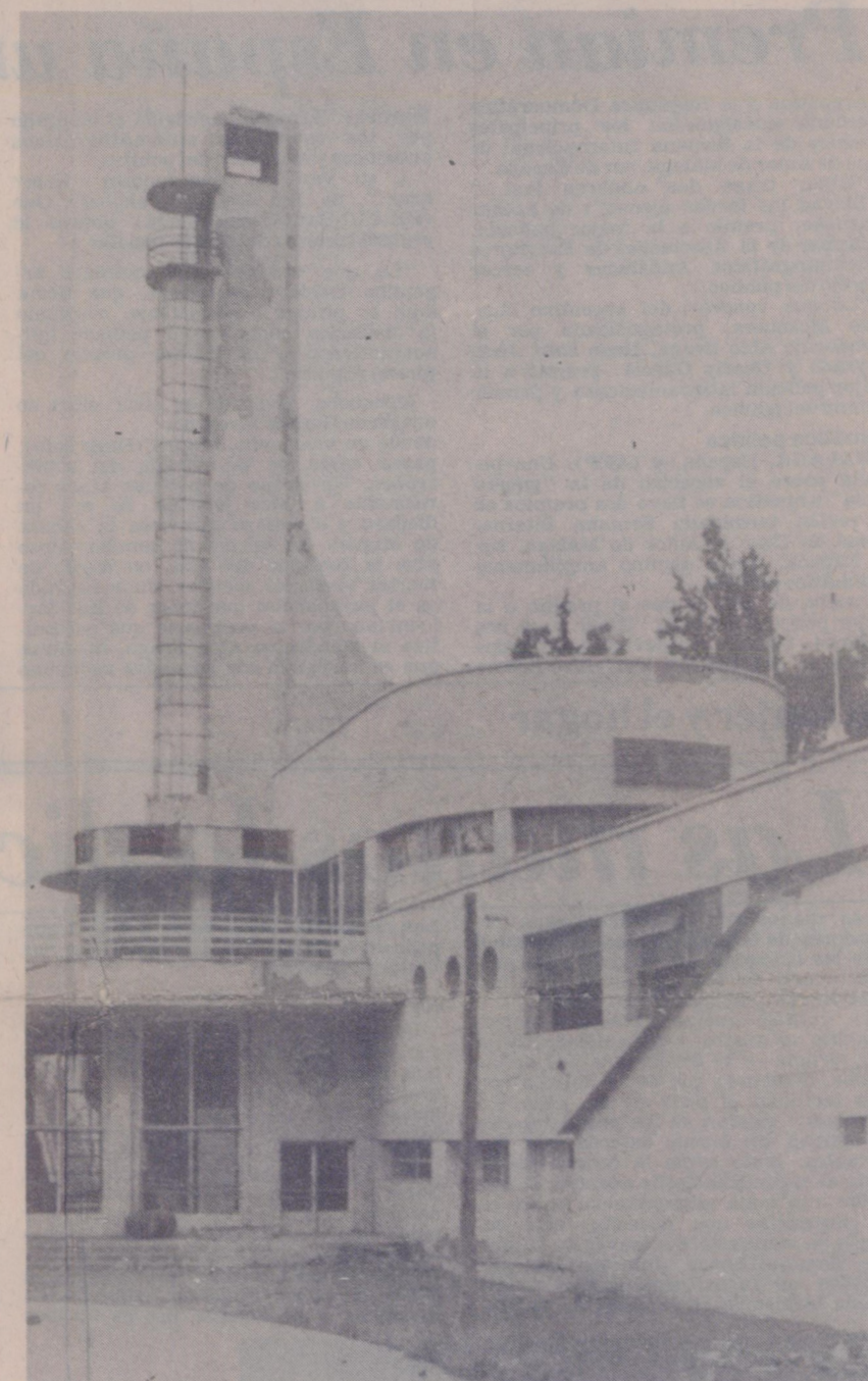
El edificio Playas Serranas, en el parque, de notable valor arquitectónico.