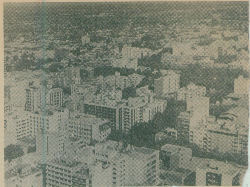
En el centro urbano de la capital la arboleda corre grave peligro. Su preservación integral es impostergable. Es la belleza heredada, que nos caracteriza, que debemos conservar y mejorar.

Hoy nos encontramos con que el legislador de nuestro inmediato futuro, urgido por los tremendos problemas de la