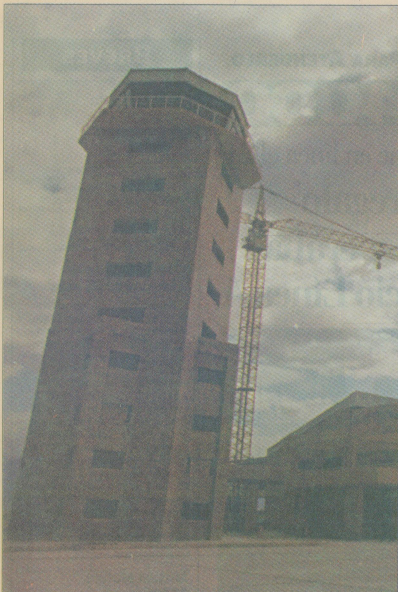
Nueva torre de control de vuelo. Estará equipada con la última tecnología en sistema de comunicaciones.

Lo construye la Fuerza Aérea Argentina, con una inversión que supera los doce millones de dólares. En el esfuerzo la acompaña el gobierno de Mendoza. Entrega belleza, tecnología y funcionalidad. Será nuestra imagen provincial para admirar.