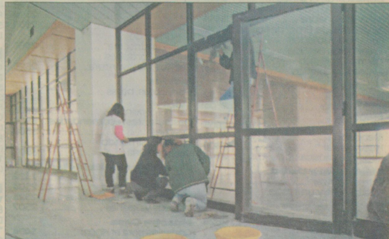
Días de terminación. Limpieza de vidrios.

generosas dimensiones y dos salas vip. Permitirán la movilización de las tripulaciones y ocupantes de varias aeronaves. Unas 1.200 personas.