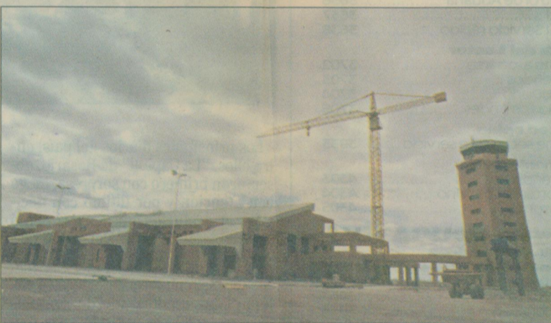
Frente de la aeroestación.

existe en las grandes estaciones del mundo. Será sencillamente impactante.