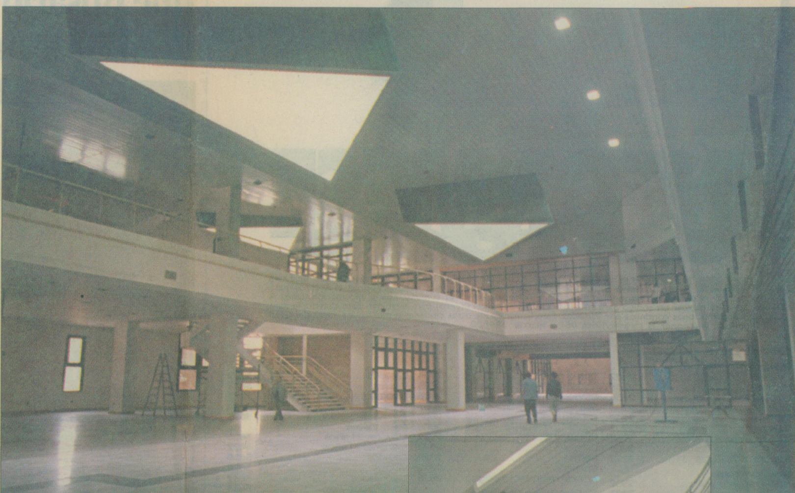
Sector de cabotaje. Planta baja.