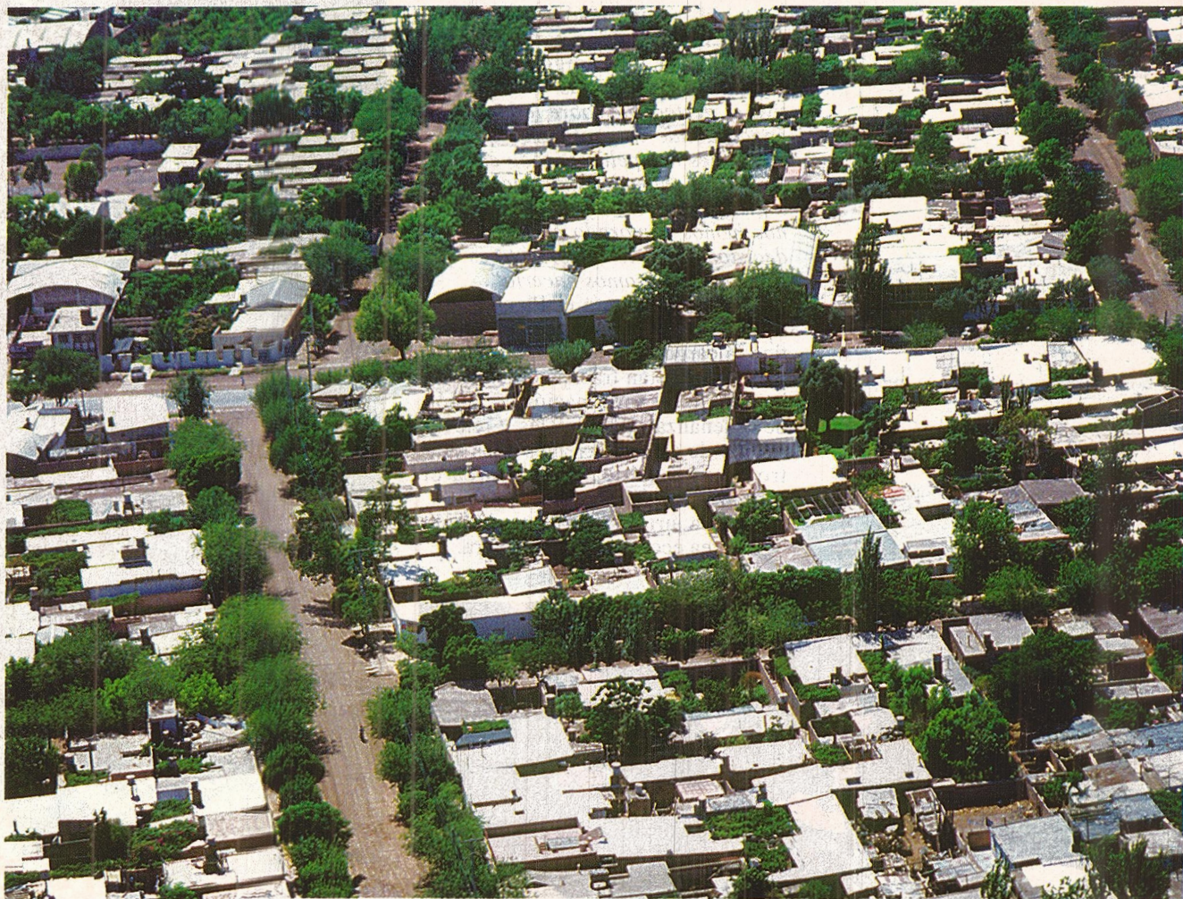
El lugar apropiado para la creación de barrios y espacios verdes surgirá de una adecuada planificación.

E n los umbrales del siglo las problemáticas que aquejan al ciudadano común han desdibujado los límites políticos de cada departamento, para conformar un territorio común. El Gran Mendoza está formado por los departamentos de Capital, Las Heras, Godoy Cruz, Guaymallén, Luján y Maipú y las casi 800.000 personas que actualmente viven en este sector de nuestra provincia, convierten a este conjunto urbano en la cuarta concentración urbana del país, después de Buenos Aires, Córdoba y Rosario.