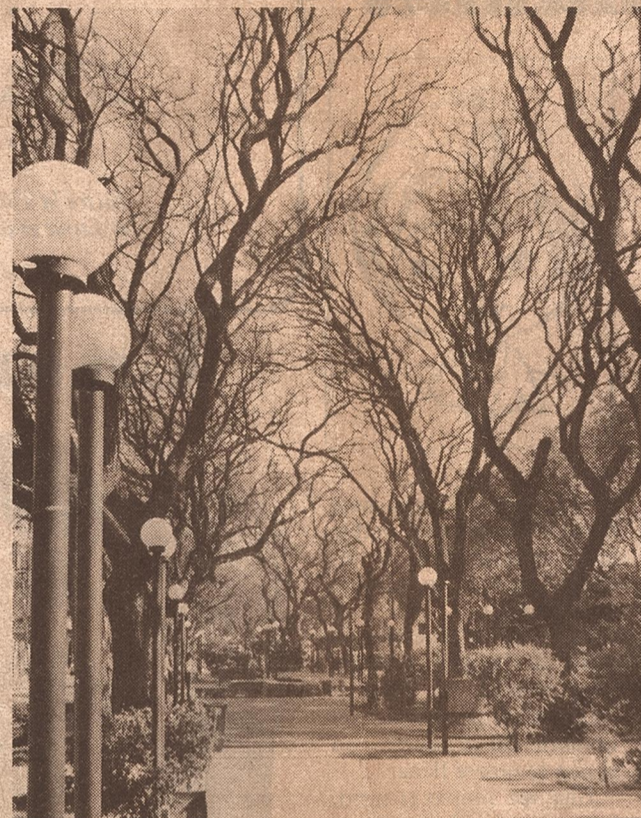
Tipos de la Alameda. Se trata de uno de los ejemplares más decorativos que tiene la ciudad. Hacia noviembre cubren de flores amarillas el paseo