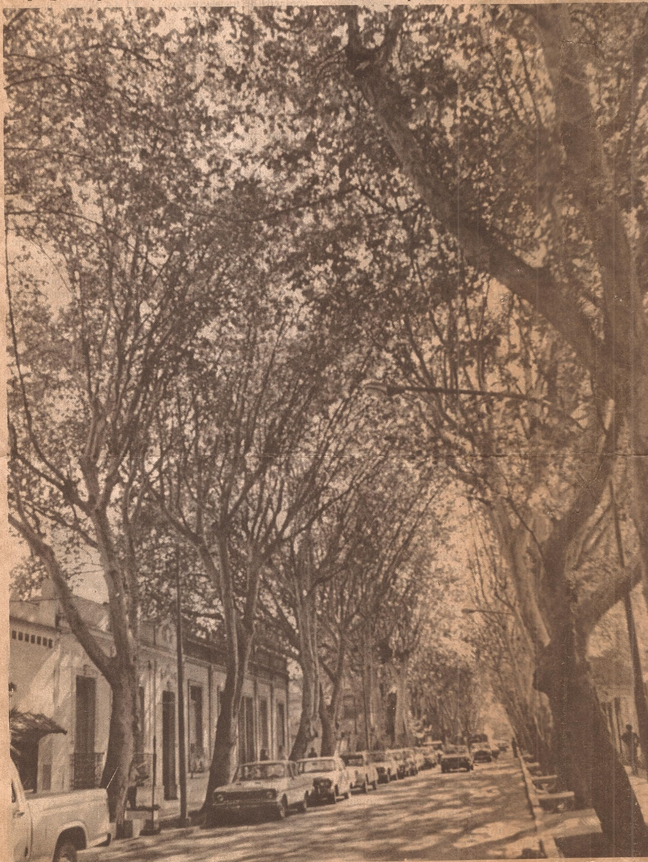
Platanos en calle San Luis. Su imponente parece achatar la edificación, terminando por formar un techo verde a casi diez metros del piso.