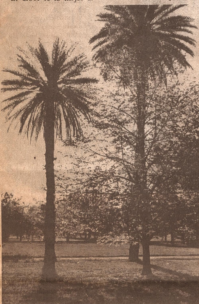
Las palmeras constituyen una rareza en la ciudad. En la foto, dos ejemplares sobrevivientes de la antigua Quinta Agronómica, en el actual Centro Cívico.

quitectura de Mendoza. En su follaje se disimulan los marrones, los ocres, las vetustez de las construcciones. El árbol uniforme, iguala, en un tono verde brillante que se "liga", a la retina que siempre se inclina por recordar lo hermoso. Y Mendoza se liga a una imagen hermosa. La imagen de un árbol que—seguramente— ha alcanzado su mejor ciclo vital, acercándose a los tres cuartos de siglo de vida útil a la comunidad. Pero no es un verde de tonalidad pareja. Son muchos los matices que la mi-