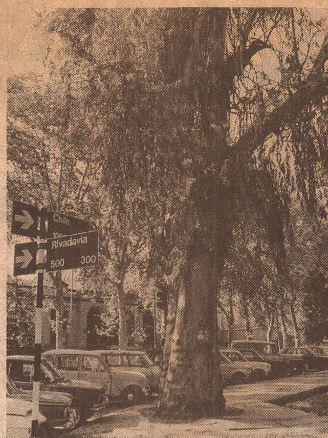
Eucalipto largamente centenario en la esquina de Rivadavia y Chile. Es de la época de la reconstrucción de Mendoza.