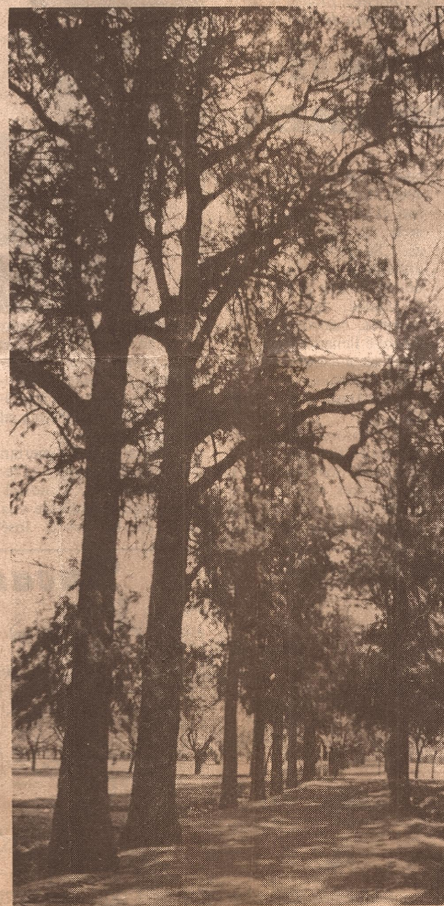
El camino central de la vieja Quinta Agronómica, intacto en el corazón del Centro Cívico.

Comienzos "Desde pequeño—recordó Atlantis— luego de ver la película "El gran Houdine" y de presenciar la prueba, la idea de hacerla se convirtió en mi casi en una obsesión. Hace ocho años empecé a realizar escapes normales con cadenas o esposas, con chaleco de fuerza, etc.; paralelamente me iba preparando para este desafío que concretaré en mi tierra mendocina en pocos días". Cabe destacar que esta prueba la llevó a cabo Houdine por última vez el 6 de octubre de 1926, en Detroit, Estados Unidos, muriendo a los pocos días de realizarla. Implica un verdadero riesgo que desde hace más de medio siglo nadie intentó reiterar en el mundo. El espectáculo, que tiene una duración total aproximada de 17 minutos, entre preparación y realización completa, ha requerido según nuestro entrevistado, muchos años de