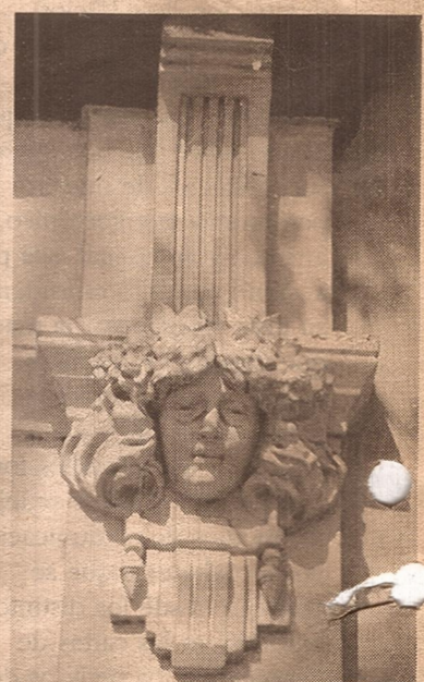
Los típicos mascarones de fachada todavía están presentes.

más cuidada factura. Estos últimos formaban parte de series inspiradas en obras reconocidas, cuya asociación daba dignidad y prestigio. Algunos que aún tenemos con nosotros, como la iglesia de la Merced, o los interiores de San Francisco, los Jesuitas y Loreto, o la escuela Mitre, nos permiten evocar modelos creados en Italia y difundidos largamente por Europa y América desde hace más de trescientos o cuatrocientos años. En el diseño