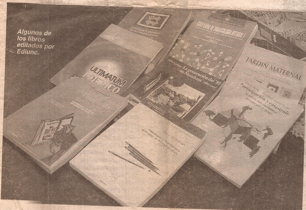
Algunos de los libros editados por Ediunc.

Primera Muestra del Libro Universitario Argentino en Mendoza