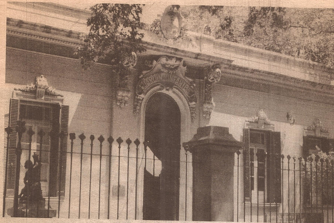
Vista del frente del jardín Merceditas de la desaparecida Escuela Patricias Mendocinas que muestra el señorío con que fue concebida la escuela.