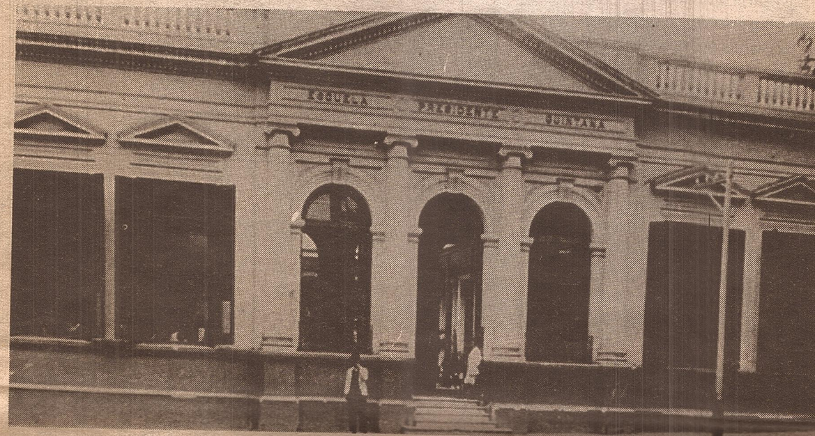
Frente del viejo edificio de la Escuela Quintana. Esta escuela tenía una de las salas de actos más hermosas de la Provincia.

El seminario sobre Patrimonio Arquitectónico y artístico que reunió la visión italiana y la circunstancia mendocina dejó no sólo conocimientos técnicos, sino que ayudó a fomar una conciencia clara de la inserción activa que tiene el patrimonio en la vida contemporánea.