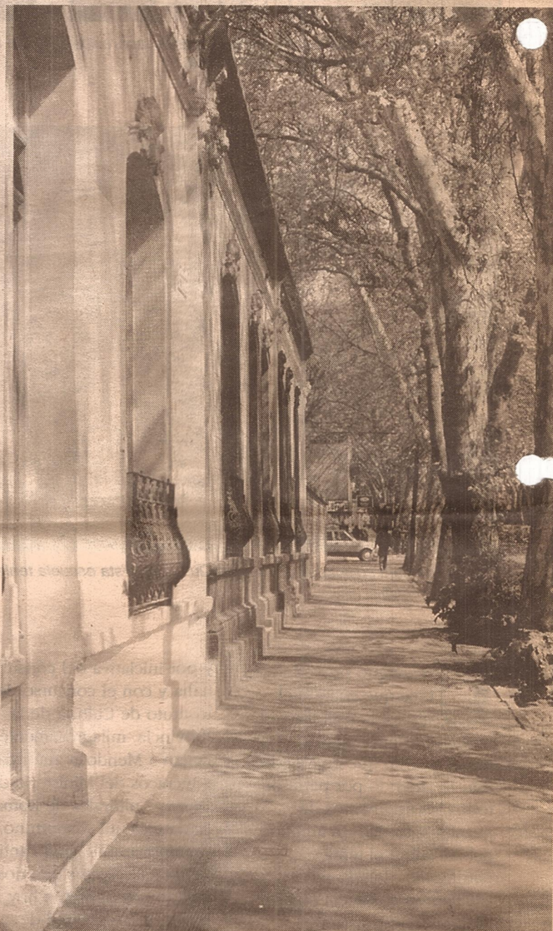
Ciertas veredas mendocinas tienen una impronta inconfundible aportada por lo italiano.

más cuidada factura. Estos últimos formaban parte de series inspiradas en obras reconocidas, cuya asociación daba dignidad y prestigio. Algunos que aún tenemos con nosotros, como la iglesia de la Merced, o los interiores de San Francisco, los Jesuitas y Loreto, o la escuela Mitre, nos permiten evocar modelos creados en Italia y difundidos largamente por Europa y América desde hace más de trescientos o cuatrocientos años. En el diseño