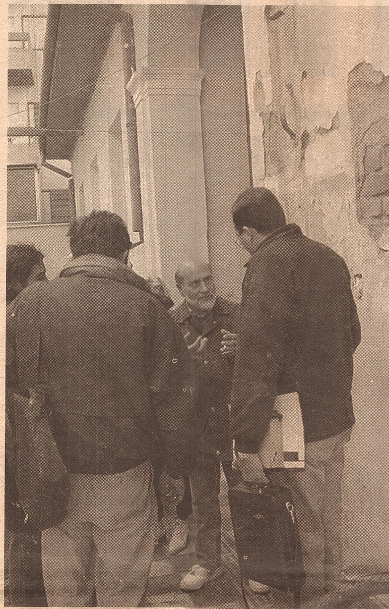
En una de las visitas -la escuela Mitre- como parte de los trabajos de campo en el seminario sobre patrimonio arquitectónico y artístico.