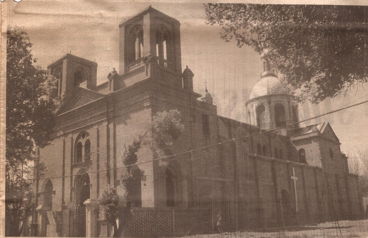
La arquitectura religiosa recibió una fuerte influencia del impacto de la inmigración italiana en Mendoza. La parroquia de La Merced es un buen ejemplo.