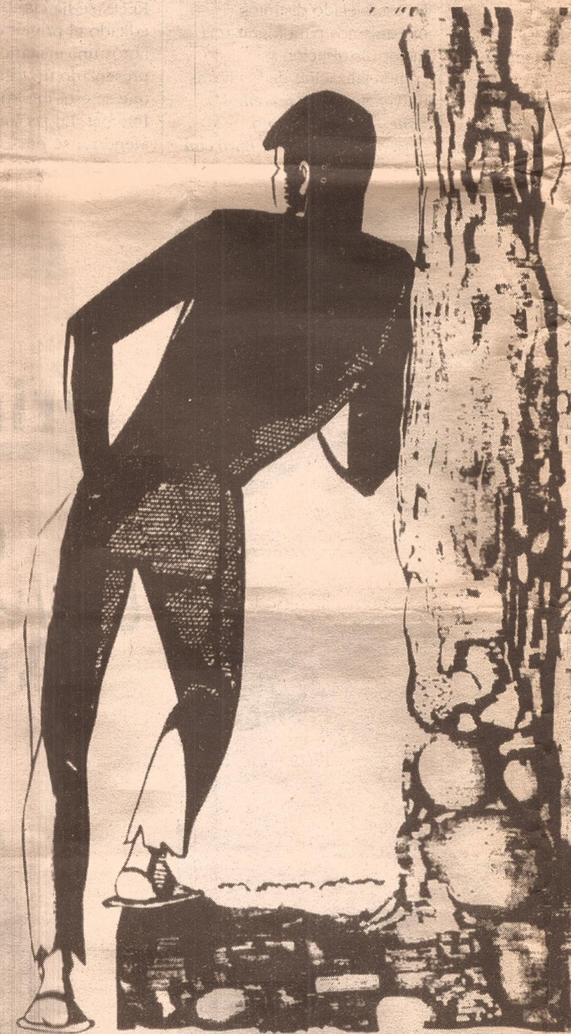
Xilografía El sentir folklórico argentino , de Dohme Fuentes Reuter, NA, EFE, Télam.