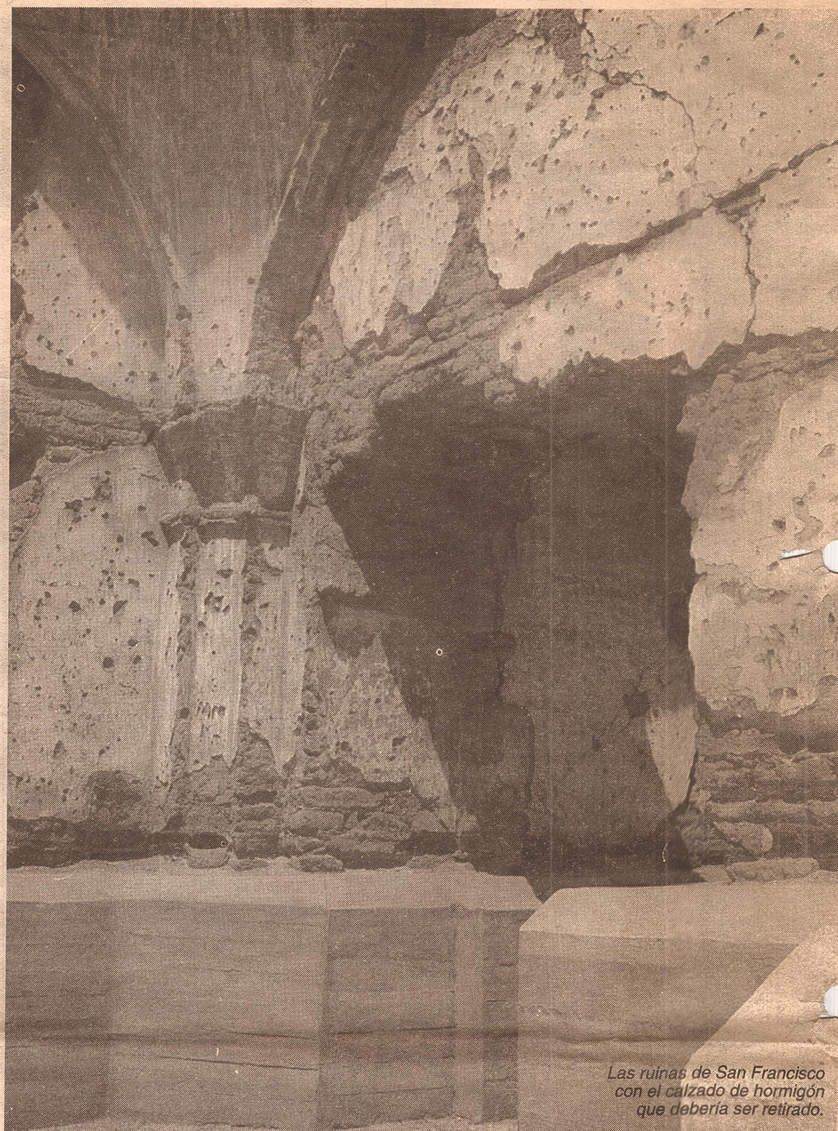
Las ruinas de San Francisco con el calzado de hormigón que debería ser retirado.