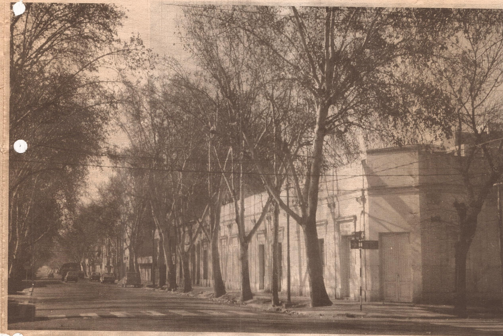
Una esquina mendocina con las tradicionales "casas chorizo".