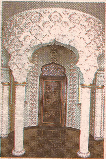
Pasen. La entrada principal.

En la entrada de la casa, en el piso de mármol, puede observarse apenas se ingresa una placa de bronce que tiene escrito "Tierra Santa Jerusalén-1972". Según nos comentó la nueva propietaria de la casa, debajo de esa placa habría tierra santa y un cofre con los nombres de las personas que construyeron la vivienda.