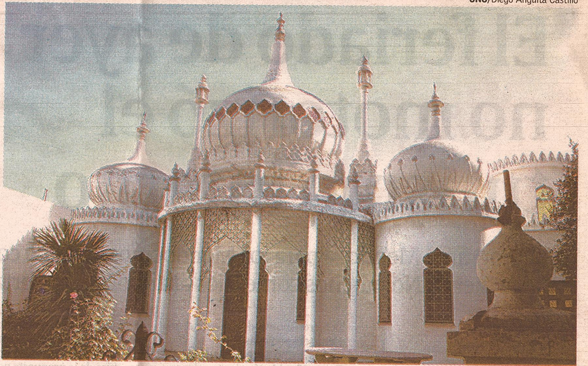
La fachada. Así se ve desde la calle la propiedad que fue levantada por un admirador de la cultura árabe.