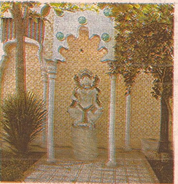
Estatua hindú. Embellece el patio.