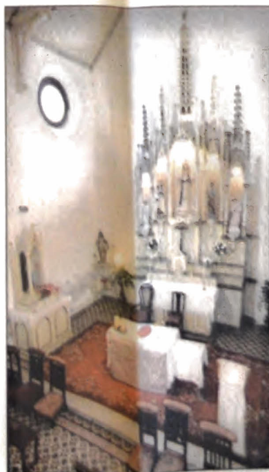
Las imágenes religiosas de la capilla son bañadas por un haz celeste que insiste en cubrir al dorado del altar.