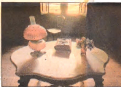
Los salones, zaguanes y habitaciones resguardan la historia en su silencio.