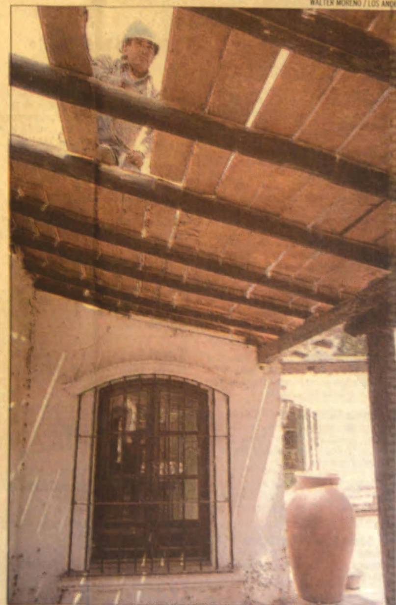
ESTILO. Con materiales de época reconstruyen la galería norte.

Cabe destacar que lo que se está haciendo actualmente en la galería forma parte de un pro-