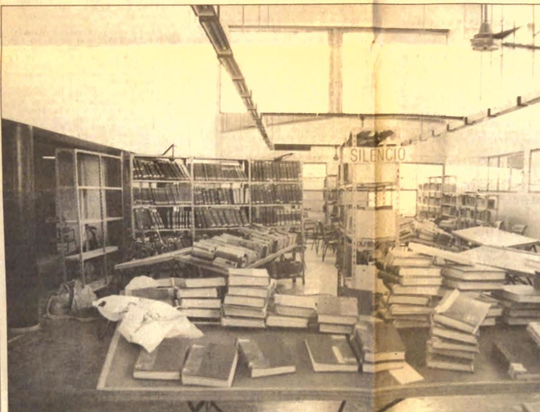
Un aspecto de las salas de lectura, mientras dura la refuncionalización. Durante todo enero, la biblioteca estará cerrada, abriendo sus puertas nuevamente en febrero.

rincón, hay un espacio dedicado a ludoteca (sector de juegos).