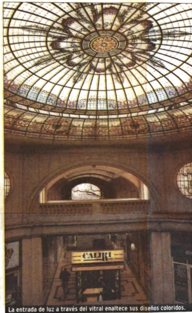
La entrada de luz a través del vitral enaltece sus diseños coloridos.