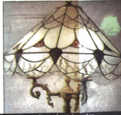
El vitral tiene múltiples usos. No sólo puede verse en enormes ventanales, sino también en lámparas, mesas, espejos y otros elementos.

(España), donde se dedica a dicho arte. También ha realizado en ese período obras en Italia y, últimamente, está a cargo del diseño, corte, armado y colocación de vitrales en la iglesia del Dulce Nombre de María (España).