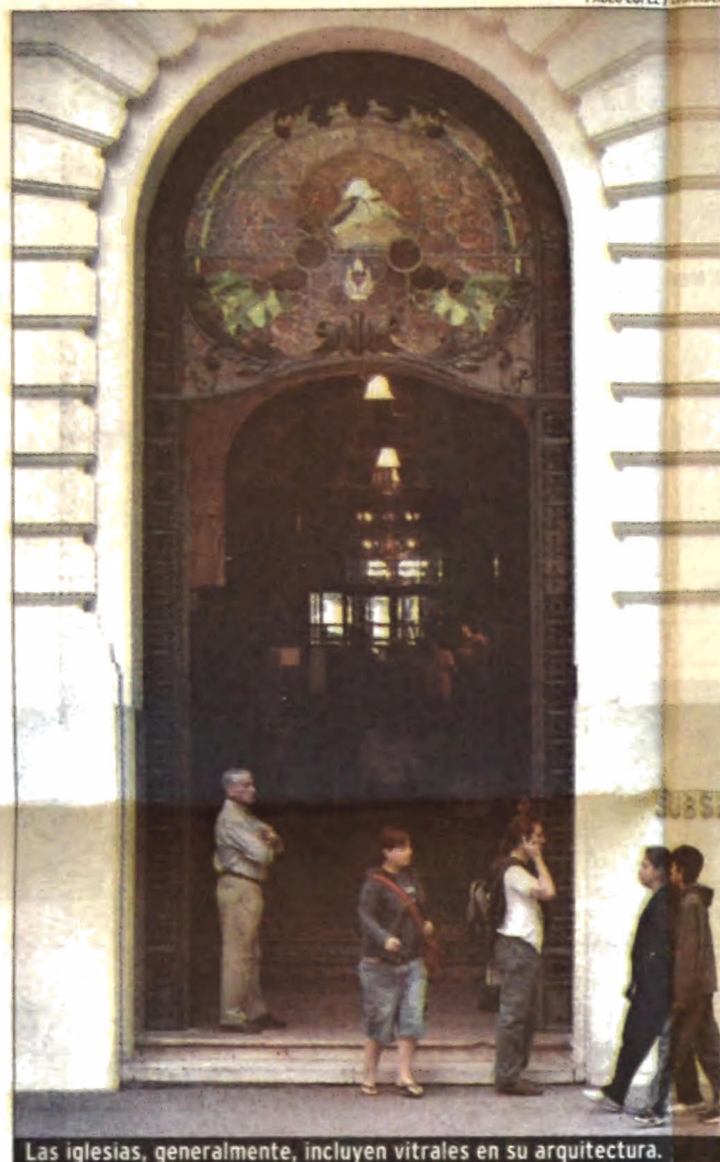
Las iglesias, generalmente, incluyen vitrales en su arquitectura.