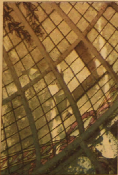
Muchos sectores están rotos.

En dos meses iniciarían las labores para devolver el esplendor a esas joyas del Pasaje San Martín