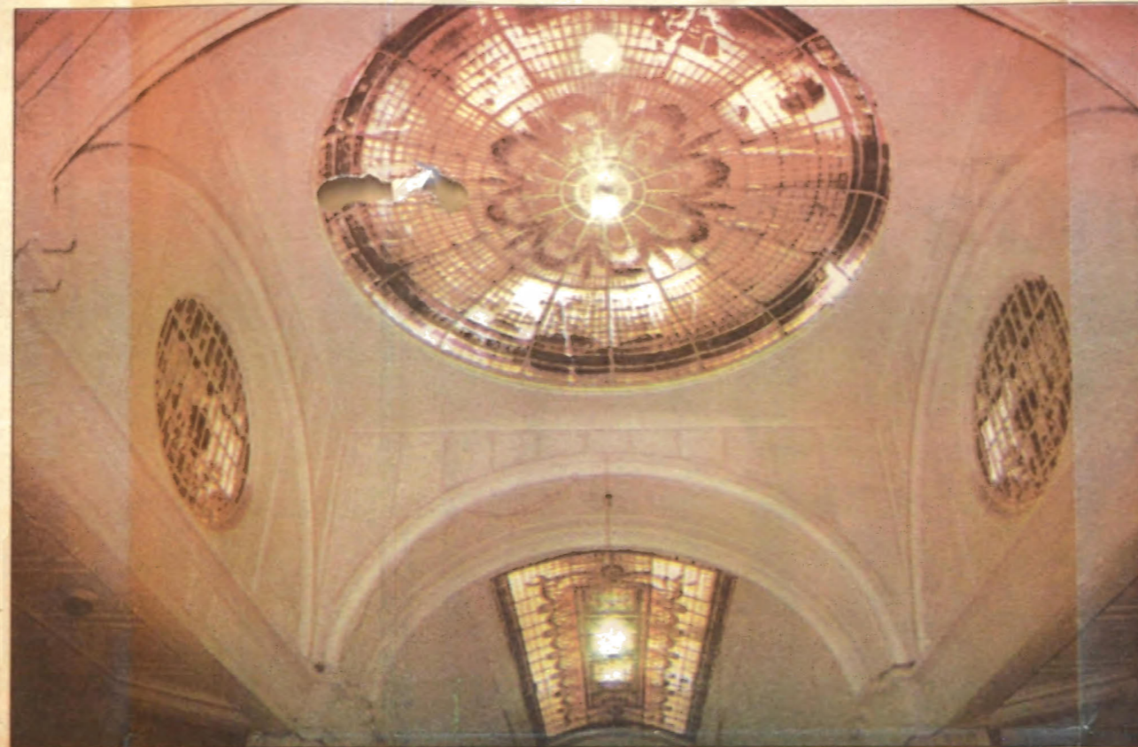
El smog y la tierra no permiten el adecuado paso de la luz.

La Comuna ya abrió una cuenta llamada "Municipalidad de Mendoza-Pasaje San Martín" en la que quedarán depositados los 100 mil pesos. En esa cuenta se acreditarán las rentas financieras que la misma genere (ingreso por multas, ventas de pliego, garantías o cualquier otra entrada que las obras originen), las