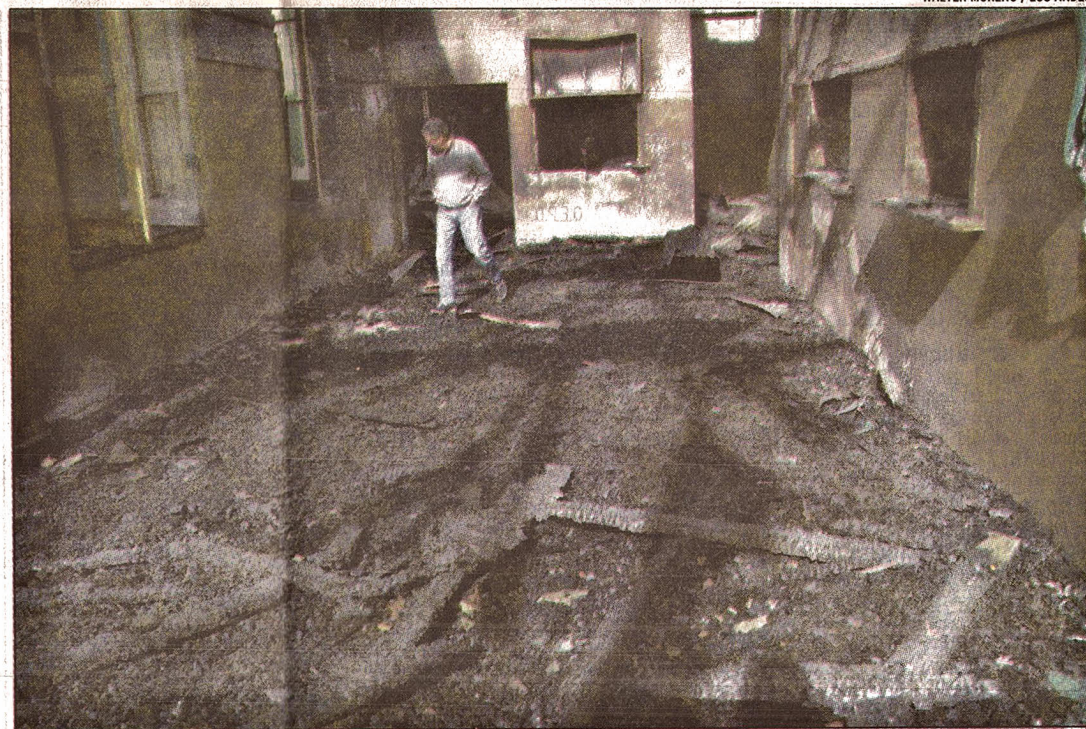
ABANDONO. Pese a las advertencias, las instalaciones ardieron el domingo pasado.