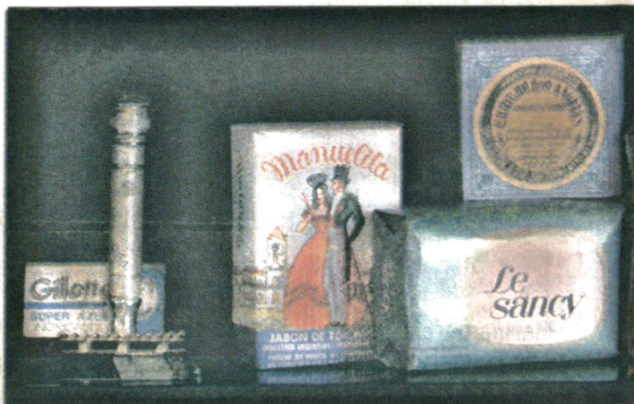
Jabones y máquina de afeitar de los '50.