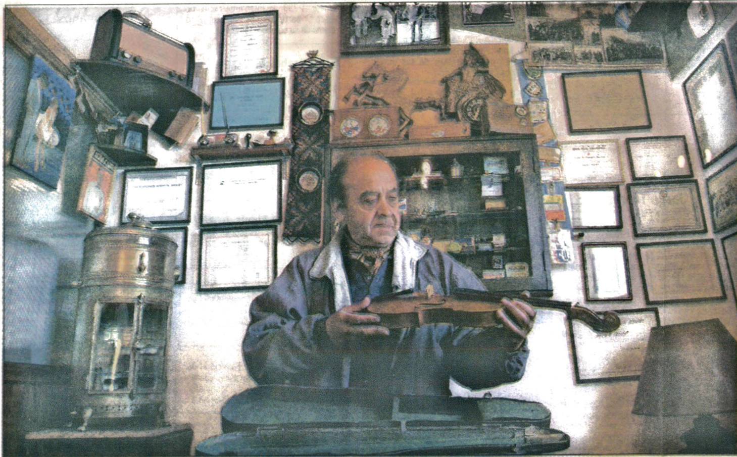
VIAJE EN EL TIEMPO. La colección de Pocho deja impresionados a clientes, amigos y vecinos

Para el final del viaje en el tiempo, Pocho tiene reservada otra sorpresa. Con mucho cuidado saca del armario una cajita de cartón, vieja pero muy bien mantenida. "Cuando éramos chicos vivíamos en Palmira y estos autitos me los regaló Perón. Todavía me acuerdo cuando vino el tren con los regalos".