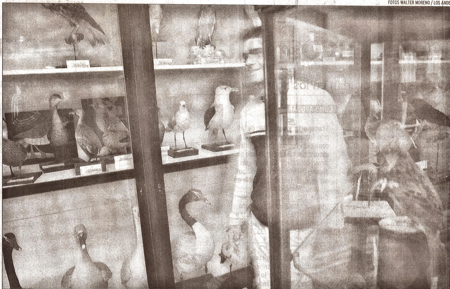
El Museo José Lorca del Liceo Agrícola tiene una amplia variedad de animales embalsamados.

Museo Arqueológico Profesor Salvador Canals Frau (Facultad de Filosofía y Letras, UNCuyo). Llamar por la mañana al 4135004 interno 2227 o visitar la página www.ffyl.uncu.edu.ar .