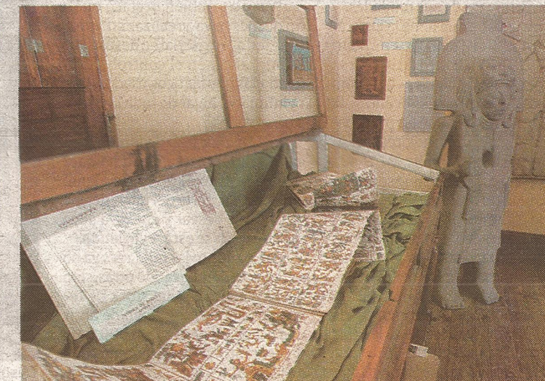
Augurios. El Códice de Borgia descifró el libro que predijo algunos eventos.