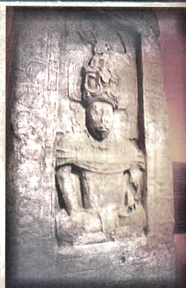
A la izquierda se observa parte de la sala histórica. Arriba, una representación de culturas mesoamericanas.