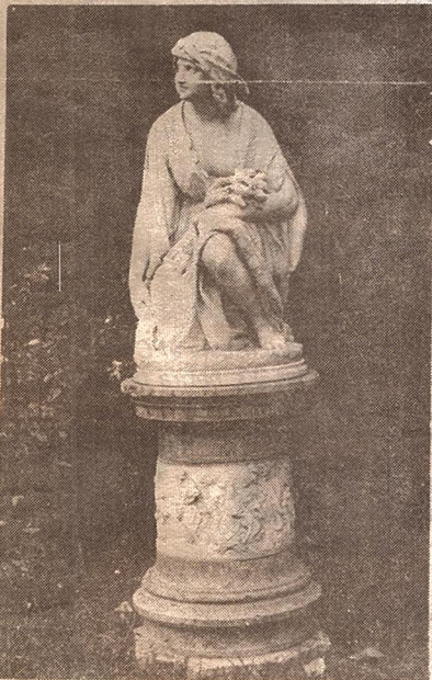
"Ruth, la espigadora", obra de Romanelli.

Desde la entrada principal dominamos visualmente toda la