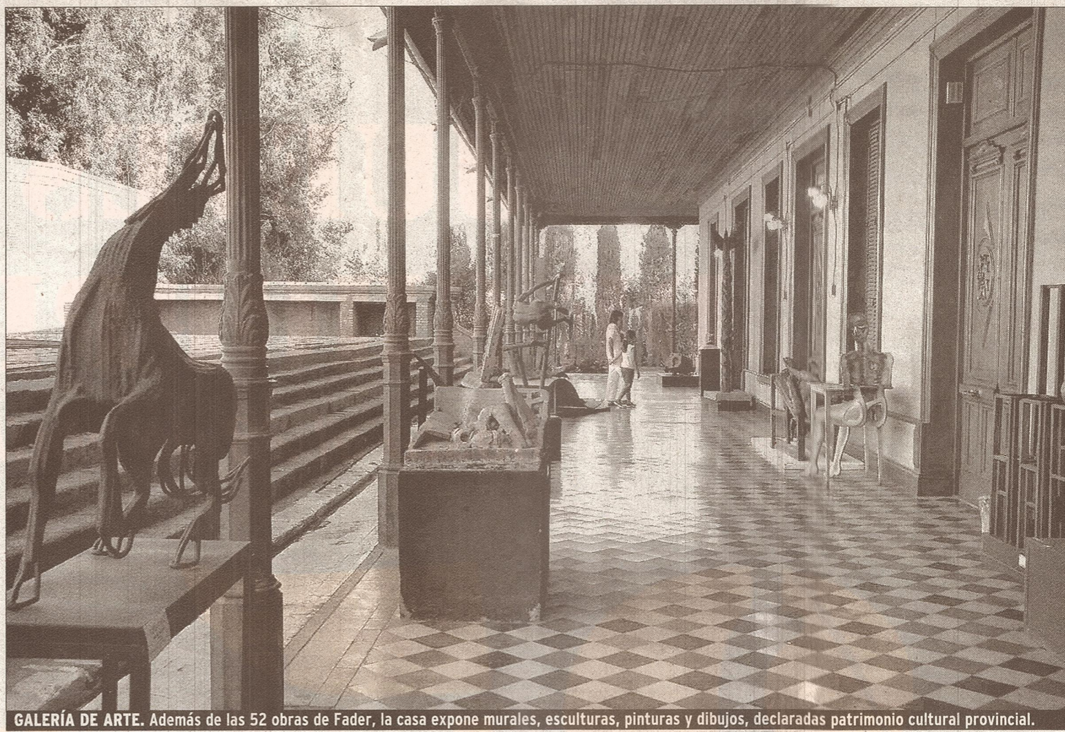
GALERÍA DE ARTE. Además de las 52 obras de Fader, la casa expone murales, esculturas, pinturas y dibujos, declaradas patrimonio cultural provincial.

Por decreto N° 1.313/45 la intervención federal en Mendoza aceptó el legado. Esta loable iniciativa, permitió a Mendoza contar con un nuevo museo de bellas artes, ya que el creado en 1927 después de varias locaciones por distintos sectores de la ciudad, había dejado de funcionar.