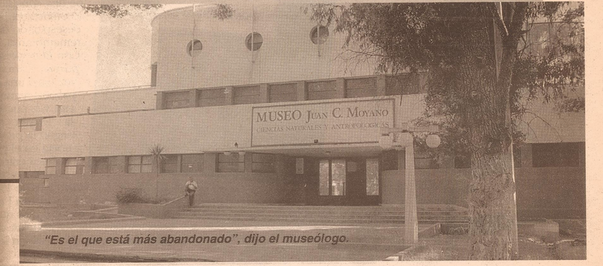
"Es el que está más abandonado", dijo el museólogo.

"Es el que está más abandonado. Es un buen museo de ciencias naturales, antropología y etnografía; tal vez convendría que lo trasladaran a un edificio con mejores condiciones, o teniendo en cuenta que está en un edificio de patrimonio que no se puede tocar, ver cuáles son las condiciones para crear un espacio más íntimo y cambiar las estructuras interiores, hacerlas más adecuadas para la exposición de las distintas especies. Si se mantuviese como museo de ciencias naturales lo que haría sería modificar lo que son las estructuras del edificio que si se pueden tocar, poner filtros para la luz, cambiar el tipo de aberturas respecto de la entrada de luz, que me imagino en los meses de verano debe ser muy cálido y las obras deben sufrir mucho".