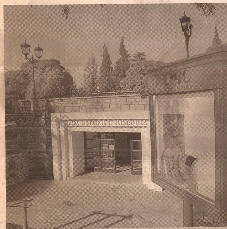
Según el especialista, el Museo de Arte Moderno es un museo correcto, y aunque pequeño, muy ágil.