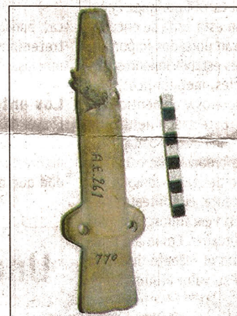
Flauta de pan (pehuenches).

históricos, por ejemplo, algunos instrumentos que pertenecieron a culturas aborígenes. Y ha unos silbatos que, se sabe, e utilizados por los huarques.