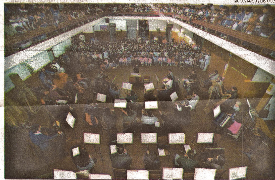
Muchos chicos de Ugarteche y Cuadro Estación nunca habían presenciado un concierto.

La otra buena notic además, una oportunidad que los artistas locales pres us instrumentos y afinen l porque se cree que en el Ce se podrán grabar y editar dis