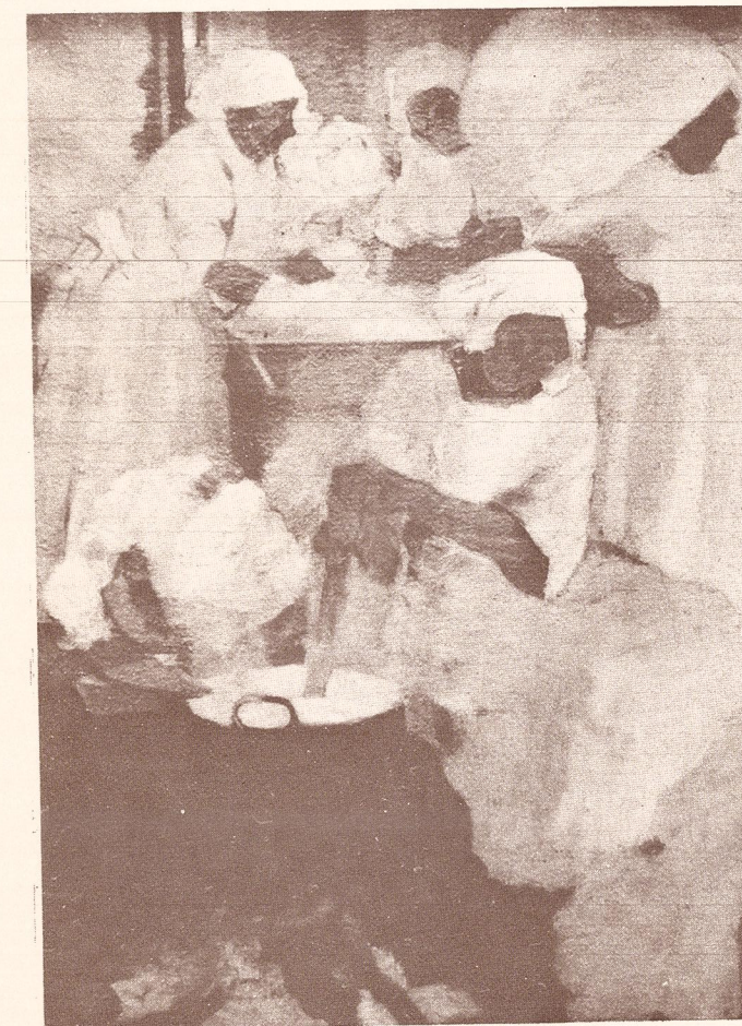
Las Lavanderas (1925)

Gobierno de Mendoza Ministerio de Cultura y Educación SUBSECRETARIA DE CULTURA