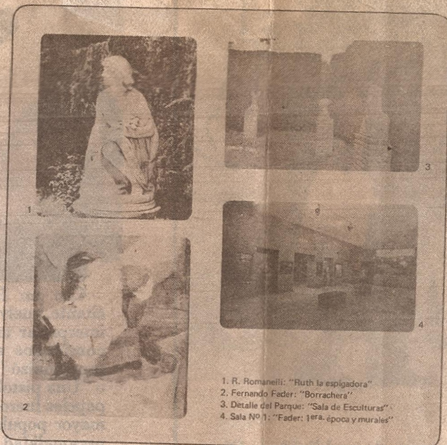
1. R. Romanelli: "Ruth la espigadora" 2. Fernando Fader: "Borrachera" 3. Detalle del Parque: "Sala de Esculturas" 4. Sala N° 1: "Fader: 1ª. época y murales"

La curiosidad es nuestra fuente de energía. Queremos agotarla a Mendoza, sacarle todo el jugo a la uva para hacer el vino del festejo. Por eso no nos olvidamos de los lugares más famosos -para los turistas- y que paradójicamente son los menos aprendidos.