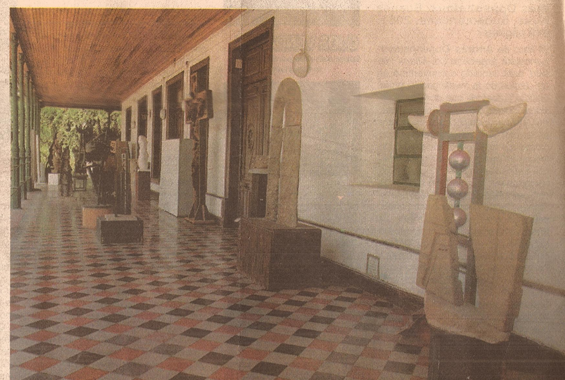
Vista de una de las galerías de esculturas donde están expuestos algunos Premios Vendimia.