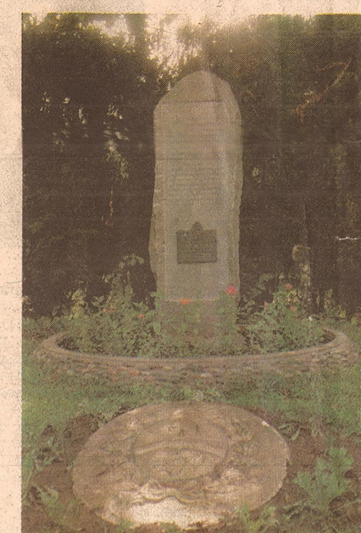
Piedra fundacional del museo que recuerda su inauguración, el 11 de abril de 1951.