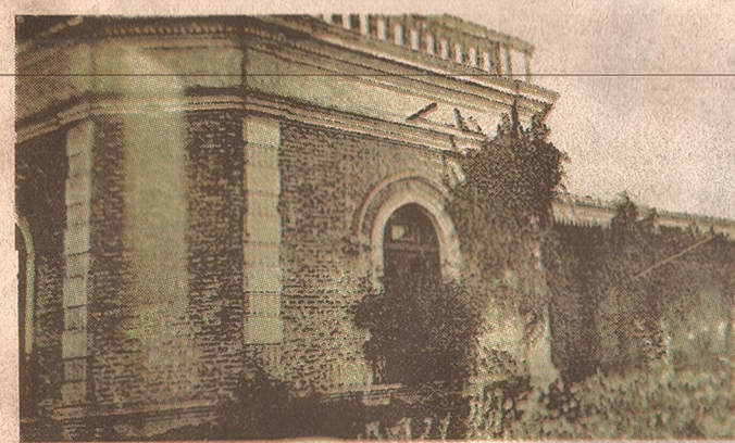
En la remodelación de la casa, llevada a cabo por Suárez Marzal, se sacaron los detalles art nouveau para darle un aspecto más formal.