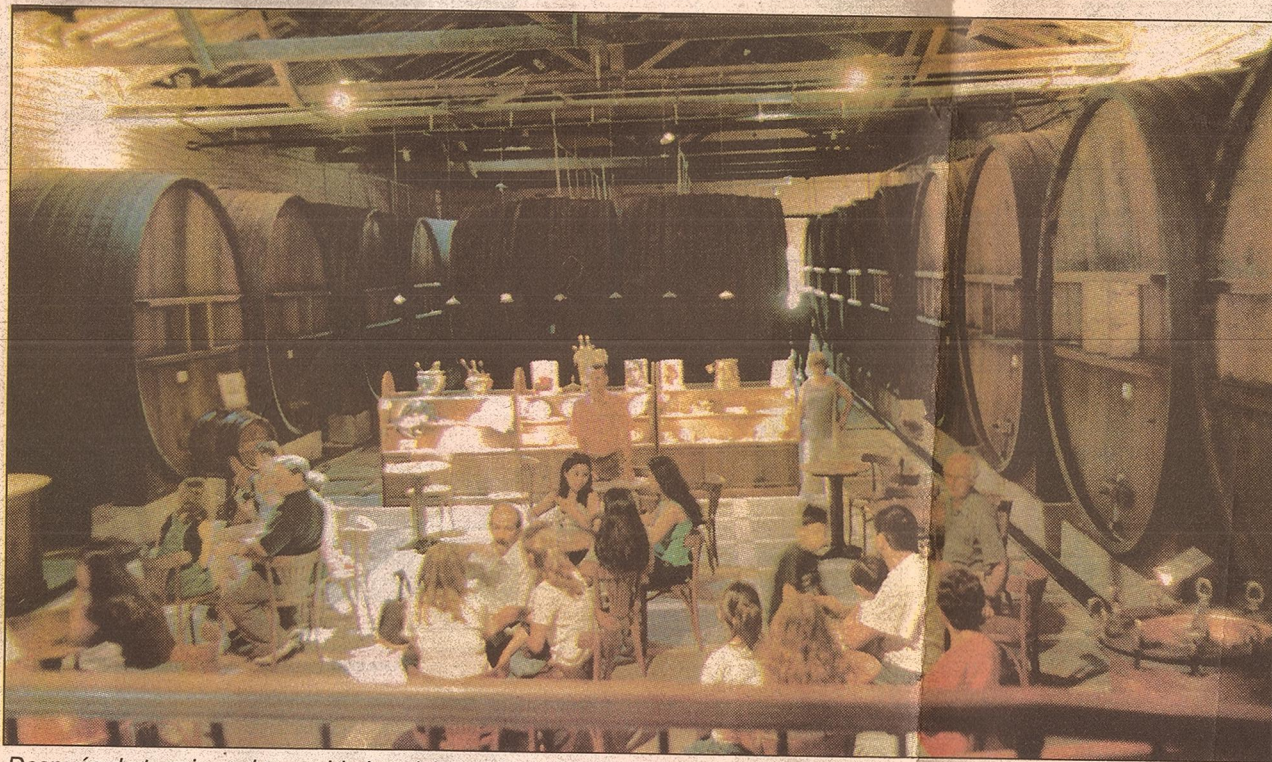
Después de terminar el recorrido los visitantes pueden probar una copa de vino en el interior de la vieja bodega