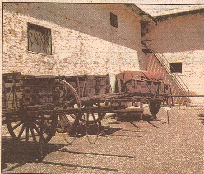
Arriba se ven los viejos carros utilizados para trasladar la uva. A la derecha la importante colección de Imaginería cuyana. Abajo, vista de uno de los sectores del museo

Los visitantes pueden realizar paseos guiados no sólo por el museo sino también por los viñedos y la moderna bodega. Al finalizar la recorrida son invitados, por las simpáticas guías, a degustar algunos de los vinos de la casa. Un detalle importante para tener en cuenta es que la entrada y los paseos son gratuitos.