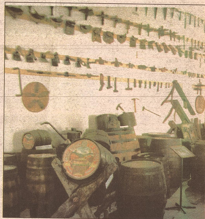
Viejas herramientas usadas por los pioneros de la viticultura mendocina se conservan en el Museo del Vino