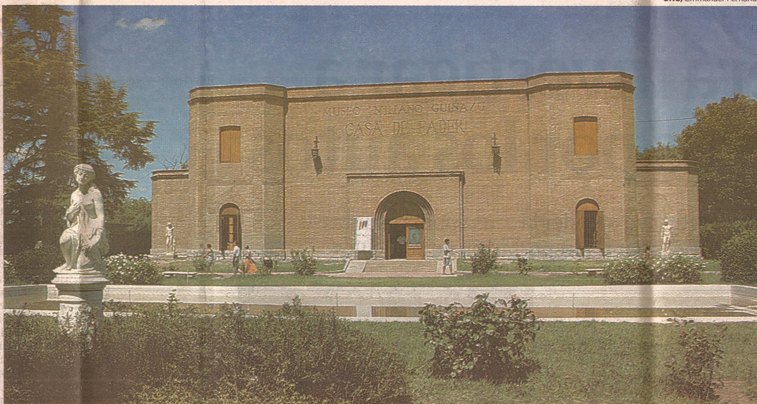
Arte puro. El Museo Provincial de Bellas Artes Emiliano Guiñazú - Casa de Fader, ubicado a 14 kilómetros de la ciudad, es una buena opción para estos días.

Al salir del edificio, en sus costados norte y este es posible recorrer la galería de esculturas, que alberga a obras de artistas locales en su totalidad.