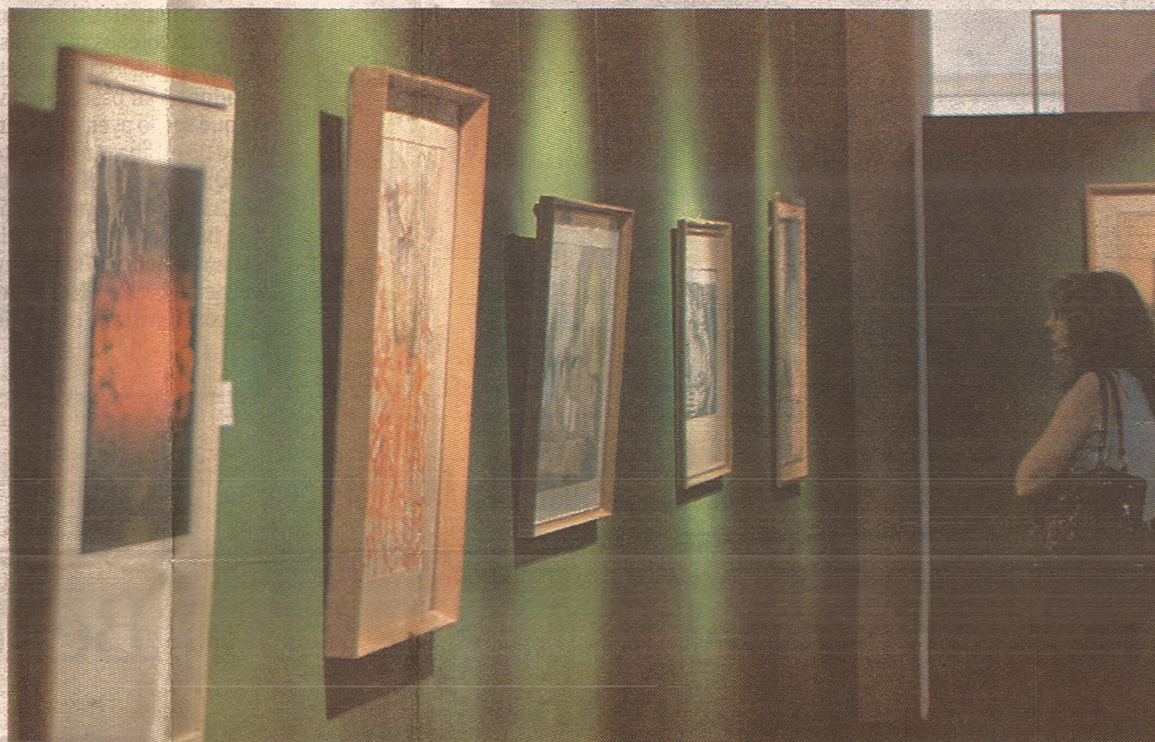
Observación. La penumbra de este pabellón crea el clima ideal para disfrutar de las formas y los colores.