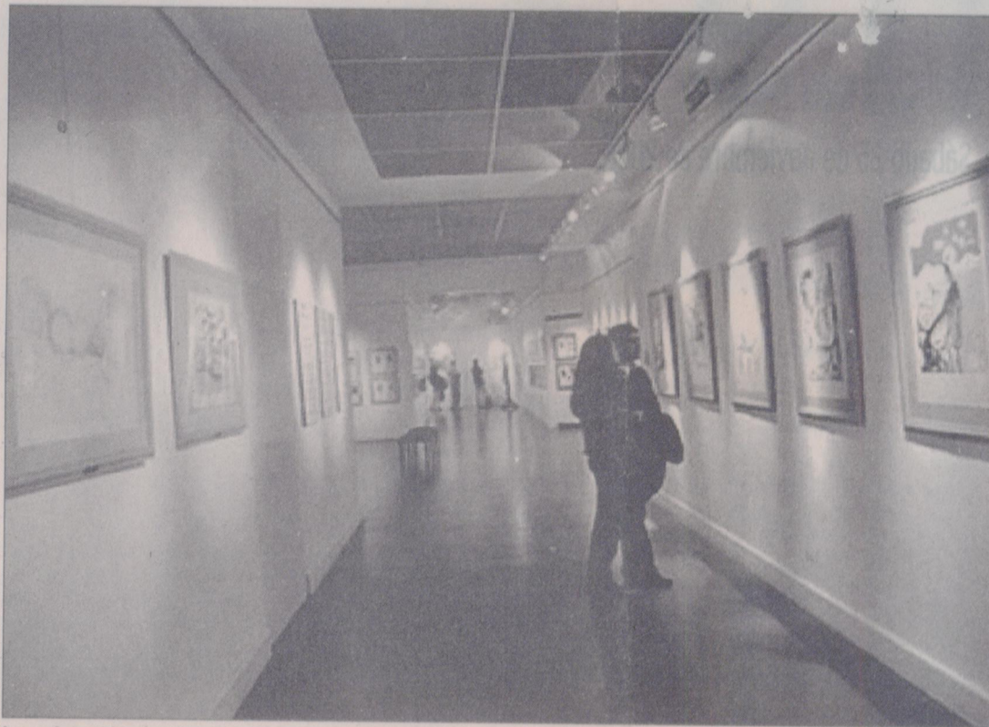
Las obras de una producción del pasado que tiene una importancia simbólica pasan al Castagnino.

-La falta de espacio se da también en museos de Europa, pero ellos venden muy bien lo suyo. ¿El gobierno de Córdoba está convencido de que la cultura es inversión?