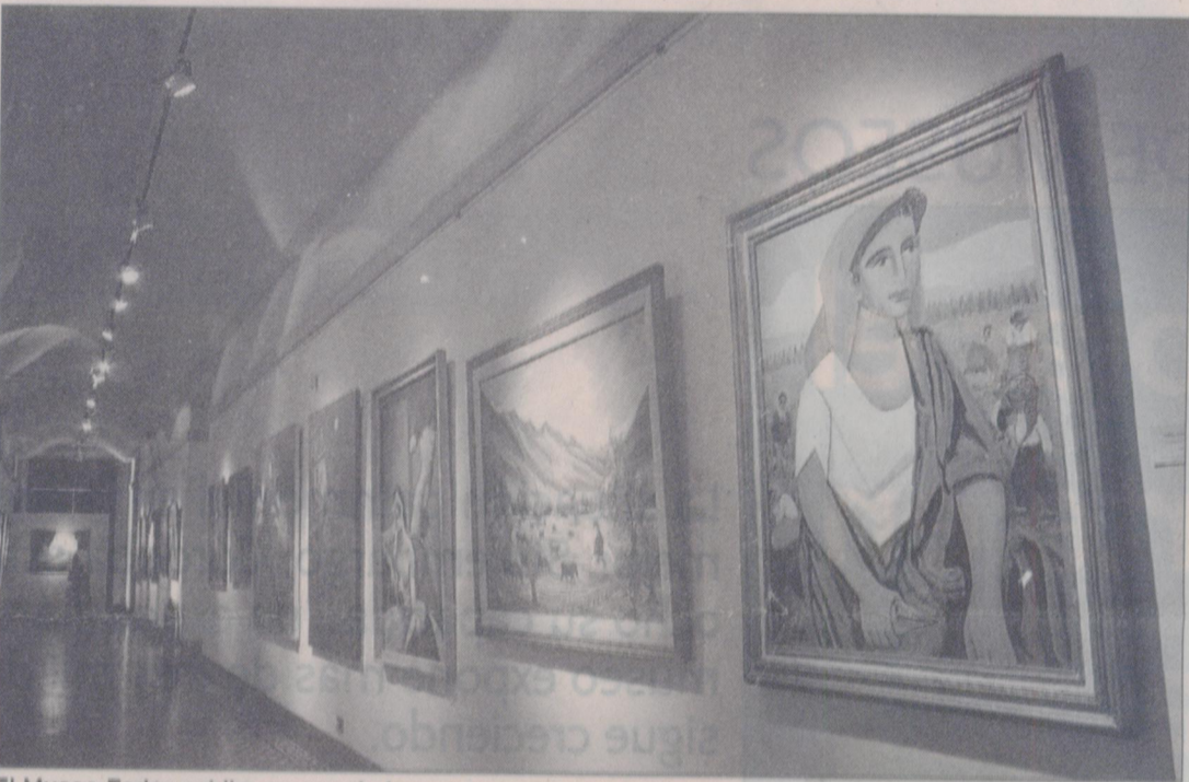
El Museo Fader exhibe menos de la cuarta parte de su patrimonio.

-Tengo la suerte de estar dirigiendo desde hace siete años la cultura de la provincia y el gobierno ha hecho una ciudad de las artes, con un teatro y un lugar de exhibición. Justamente, antes de venir a Mendoza, me dieron cuarenta mil dólares para el aire acondicionado. Estoy dando datos concretos. Solamente ese centro con un teatro, en un predio carísimo, costó arriba de diecisiete millones de dólares. Muchas veces, los gobiernos y a veces no es ajeno el mío, caen en la tentación del espectáculo, que es cultura, estoy totalmente de acuerdo, pero si uno analiza, ve que hay pocos espacios nuevos y hay que construir nuevos, con la museología moderna, tratando de que sean dignos. En