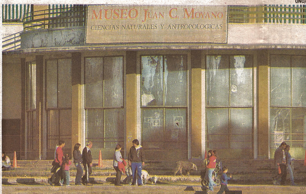
En emergencia. El edificio que ocupa el Cornelio Moyano tiene 71 años y siempre fue sometido a arreglos parciales.

La medida será por tiempo indeterminado, mientras se realizan obras profundas. La lluvia del miércoles afectó parte de la colección y se descubrió que había graves problemas estructurales