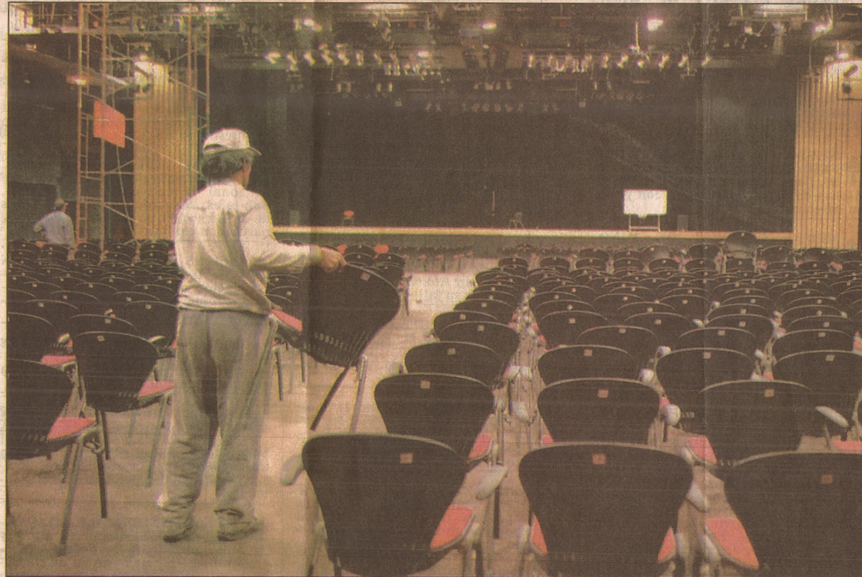
La nueva sala permitirá incrementar el potencial de Mendoza como sede de congresos y exposiciones. Una forma de incrementar los ingresos de la provincia.

Para la construcción del Auditorio se invirtieron 4 millones de dólares en la obra civil, cuya ejecución demandó alrededor de 15 meses, período en el que se crearon 150 puestos de trabajo. Una cifra similar se invierte en el equipamiento de última generación en materia de sonido, audio, video, iluminación y traducción simultánea.