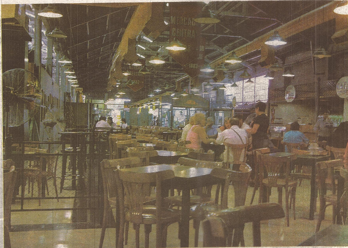
Más grande. El patio de comidas, donde funcionan una pizzería, una confitería y una parrillada, será ampliado.

El Mercado Central ocupa media manzana ubicada entre Las Heras, Patricias Mendocinas, General Paz y España. Tiene salida a las tres primeras calles mencionadas. Por día, pasan por sus pasillos miles de personas, entre las que hay una importante cantidad de turistas, indicó