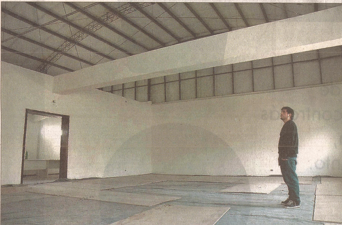
REMODELACIÓN. La sala de arte cuenta con un nuevo techo de estructura metálica y más liviano que el antiguo.