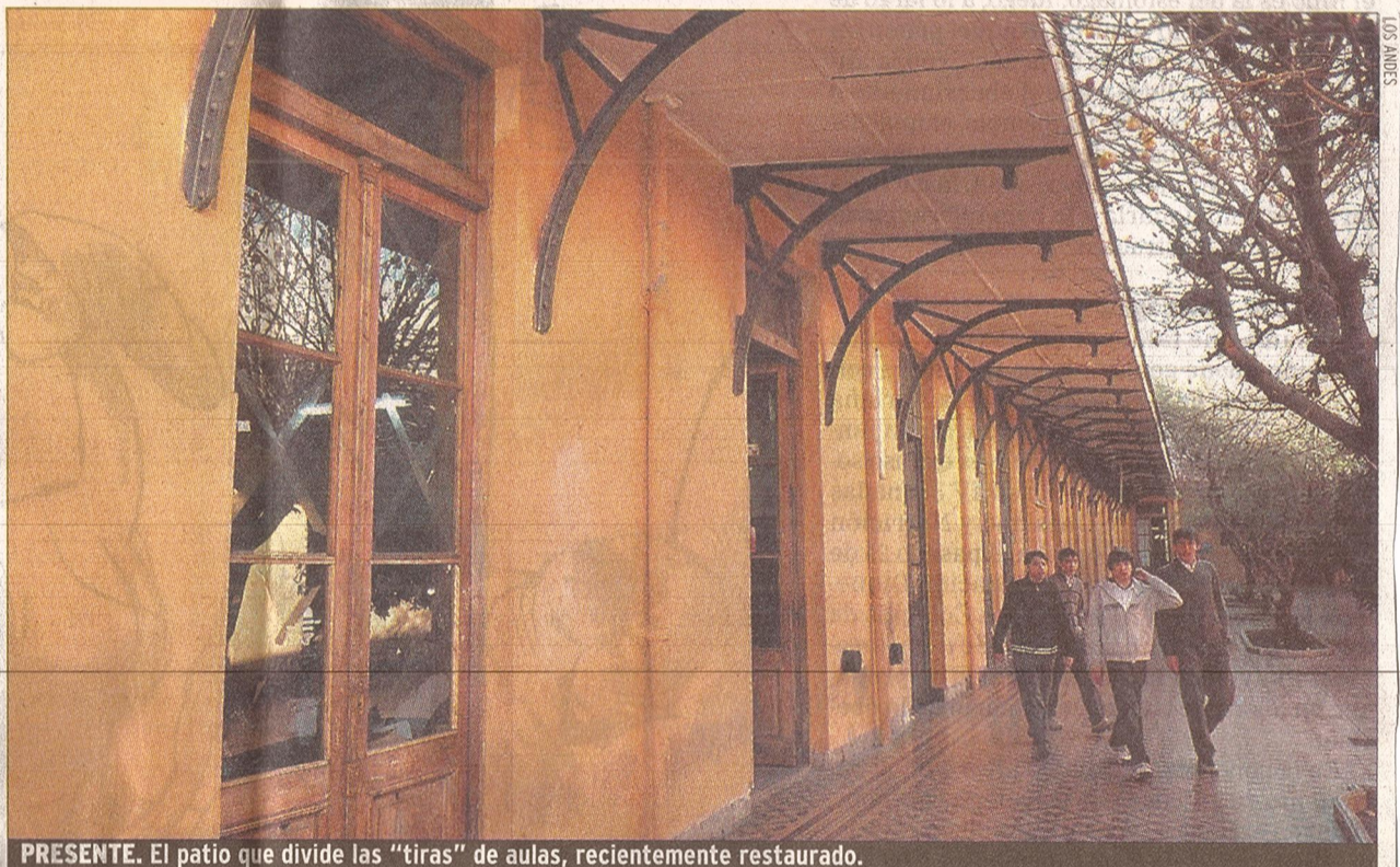
PRESENTE. El patio que divide las "tiras" de aulas, recientemente restaurado.