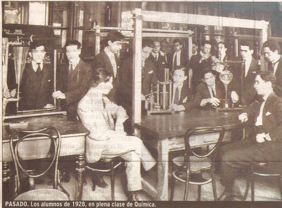
PASADO. Los alumnos de 1928, en plena clase de Química.

Tres arquitectos mendocinos idearon un proyecto para recuperar el antiguo edificio, en el que funcionan dos instituciones. La obra, de hacerse, costaría $ 14.000.000. Se restaurarían 3.400 metros cuadrados actuales y se construirían 3.100 metros cuadrados más.