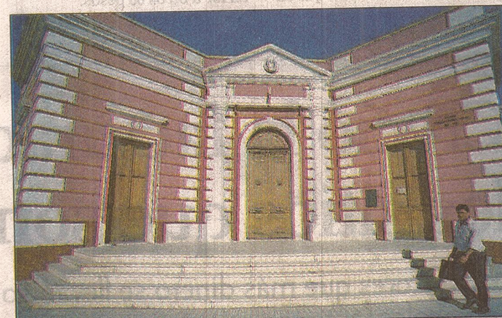
El Concejo Deliberante es uno de los edificios históricos.