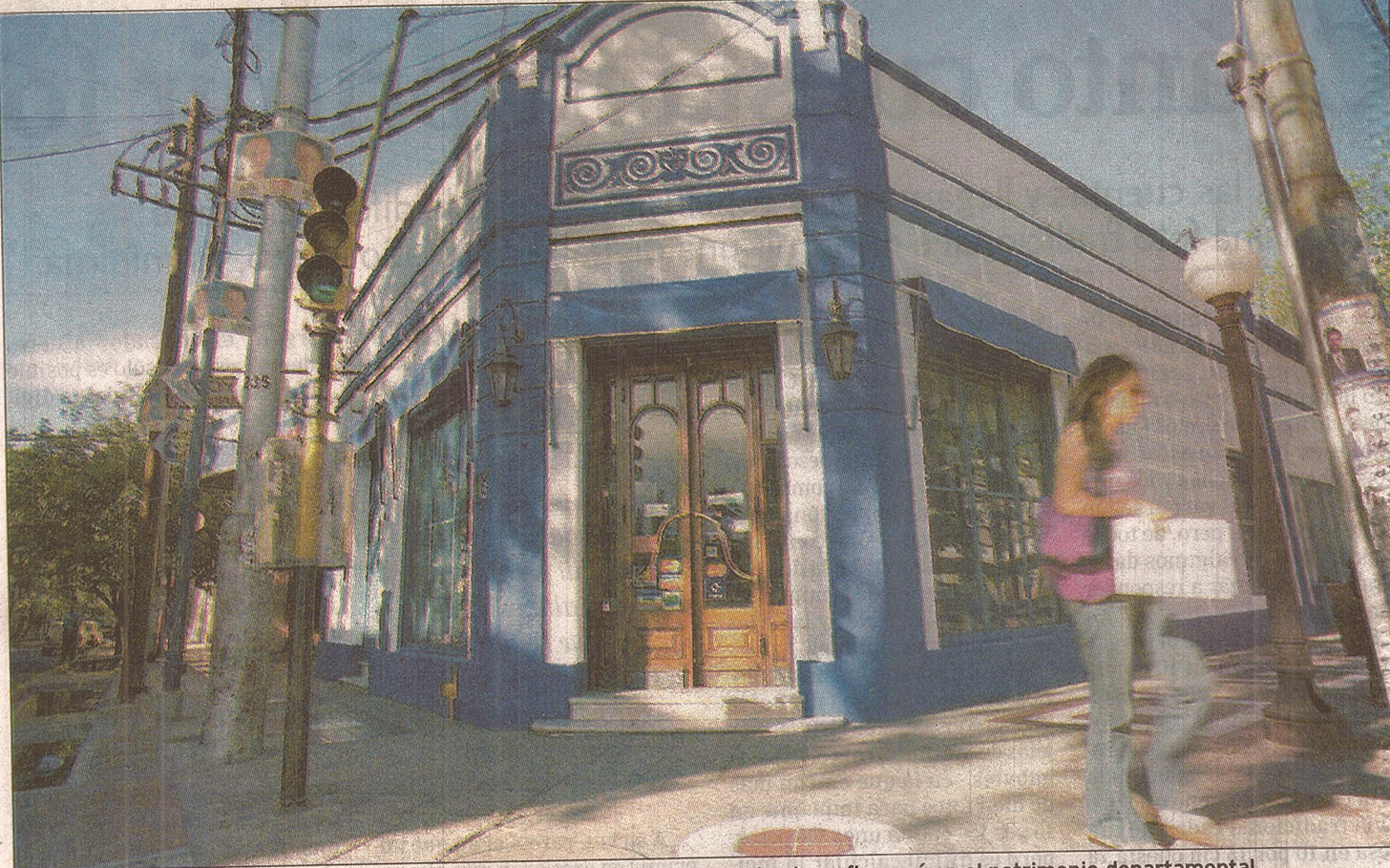
ESQUINA CON HISTORIA. La farmacia de Tomba y Rivadavia, frente a la plaza, figurará en el patrimonio departamental.

En un trabajo previo a la firma del acuerdo, se hizo un relevamiento en el cual están incluidas 100 edificaciones. Esta