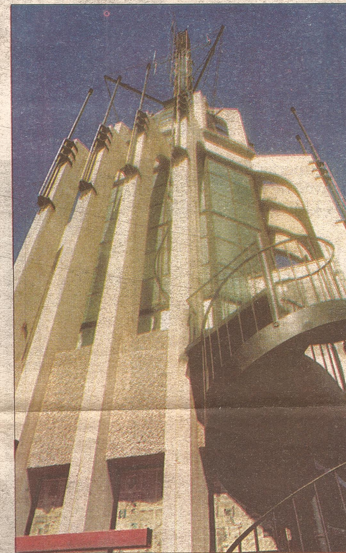
Circulan por su hall central 300 personas por hora. Los años en contacto con el smog de la Ciudad han afeado su imagen exterior. La administración planea hacerle una limpieza, remodelar la entrada y reciclar los ascensores.

Para el futuro, Naci sueña con modernizar el hall de entrada sin cambiar su estilo, hacer una limpieza exterior de la construcción, afeada por el excremento de las palomas y por el smog que también ensucia toda la ciudad. También se reciclarán los dos ascensores y el montacargas, según contó Naci.