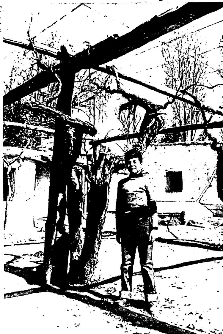
La casa en donde estuvo el molino y batán de Tejeda, tal como se conserva en la actualidad.

...galpón activando una serie de ruedas dentadas que daban movimien-