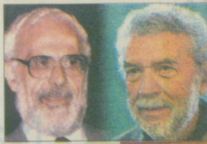
Robbe Grillet-Di Benedetto

Dos grandes de la literatura, una visión compartida y un encuentro en Italia.