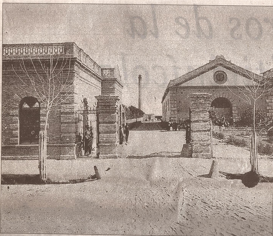
Entrada principal de la Bodega La Colina de Oro. (Foto de 1903-Biblioteca INV)