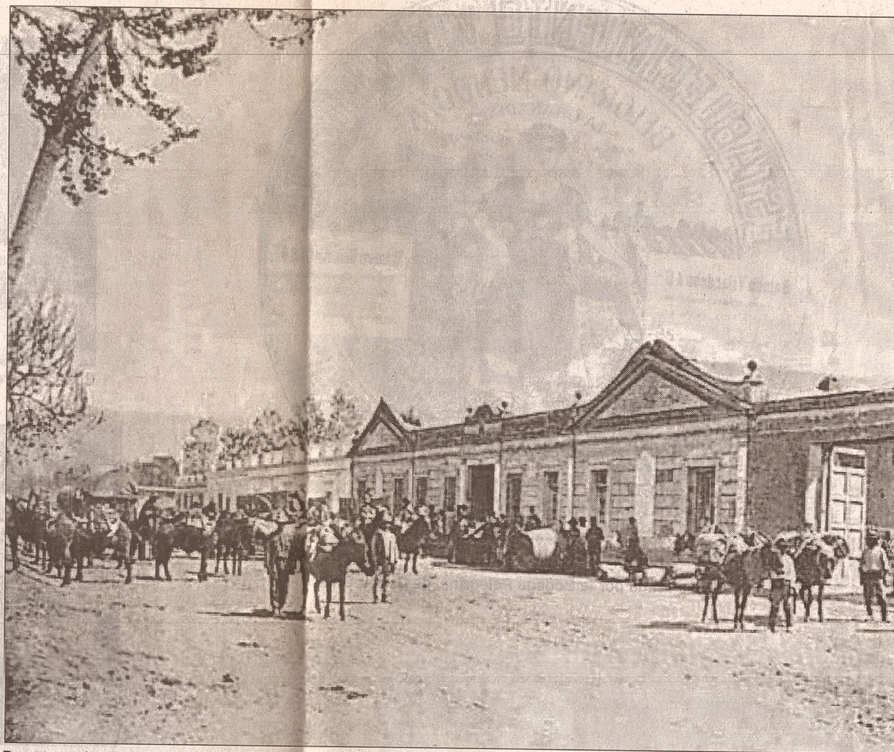
Descarga de cosecha en un antiguo establecimiento de fines del siglo XIX.