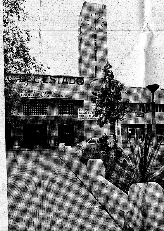
Abandonada. Estación del FC Belgrano, en San José.

Lleva ese nombre desde que se inauguró, el 7 de junio de 1950, cuando ese barrio recién comenzaba a surgir a la par del