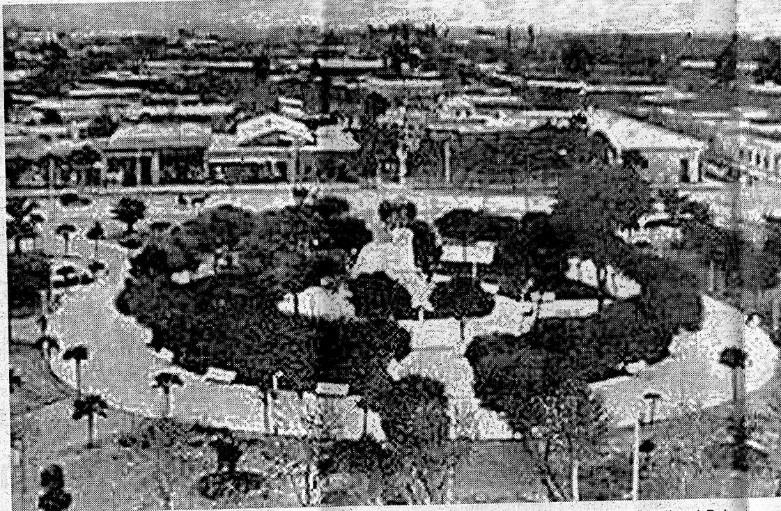
Godoy Cruz. Así lucía a inicios de la década de 1920 el centro de la comuna que por 20 años se llamó Belgrano.

Sin embargo, los habitantes de la villa seguirían siendo identificados como "vicentinos" hasta que el 9 de febrero de 1909, la Legislatura sancionó la ley que le confirió status de ciudad y la rebautizó Godoy Cruz. Así el hombre clave de San Martín en el Congreso de Tucumán pasó a ser patrono departamental en sintonía con los actos del Centenario que se realizaron en Mendoza al año siguiente, lo que se resaltaría con la inauguración de una estatua de Tomás Godoy Cruz en el centro de la plaza comunal, lo cual recién sucedió el 9 de julio de 1924.