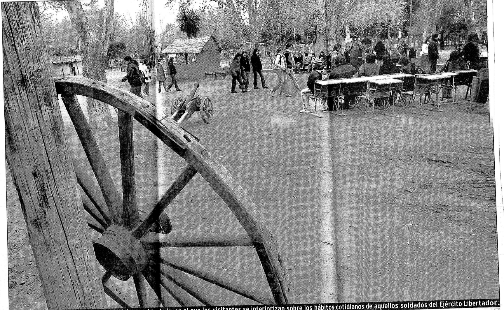
Un instante de relax en el recorrido del área ambientada, en el que los visitantes se interiorizan sobre los hábitos cotidianos de aquellos soldados del Ejército Libertador.