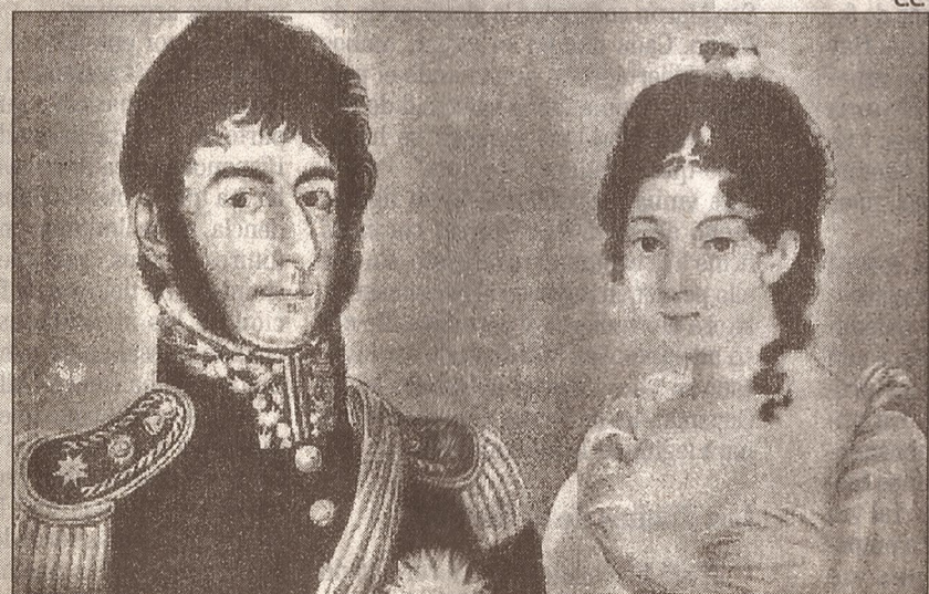
Cuando San Martín la conoce, Remedios de Escalada no había cumplido los 15 años...