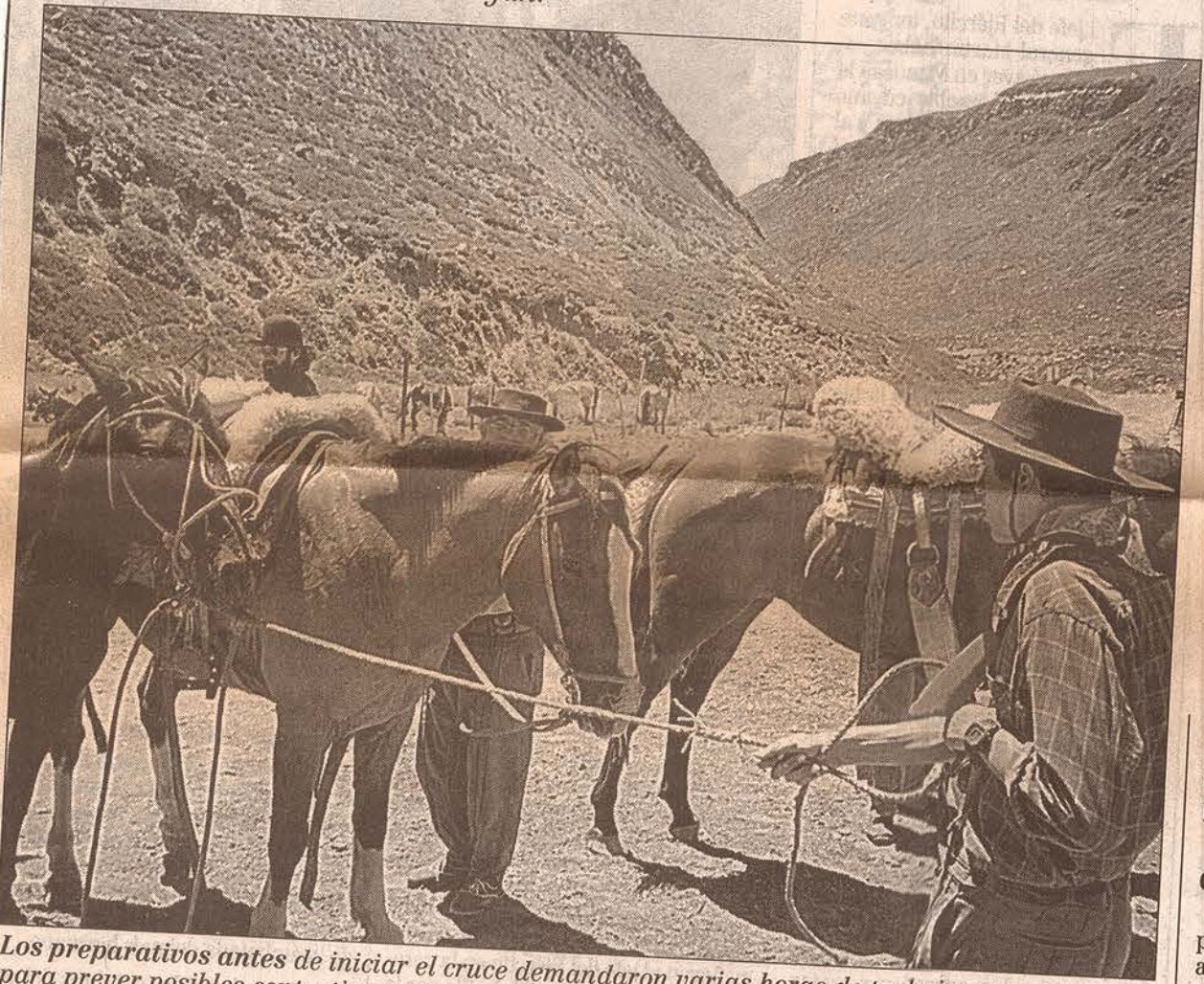
Los preparativos antes de iniciar el cruce demandaron varias horas de trabajo a conciencia para prever posibles contratiempos.

Se trata de la Agrupación Cabalgata Histórica de San Lorenzo (Santa Fe). Completó el primer recorrido de 1.200 kilómetros en el departamento de Tunuyán.