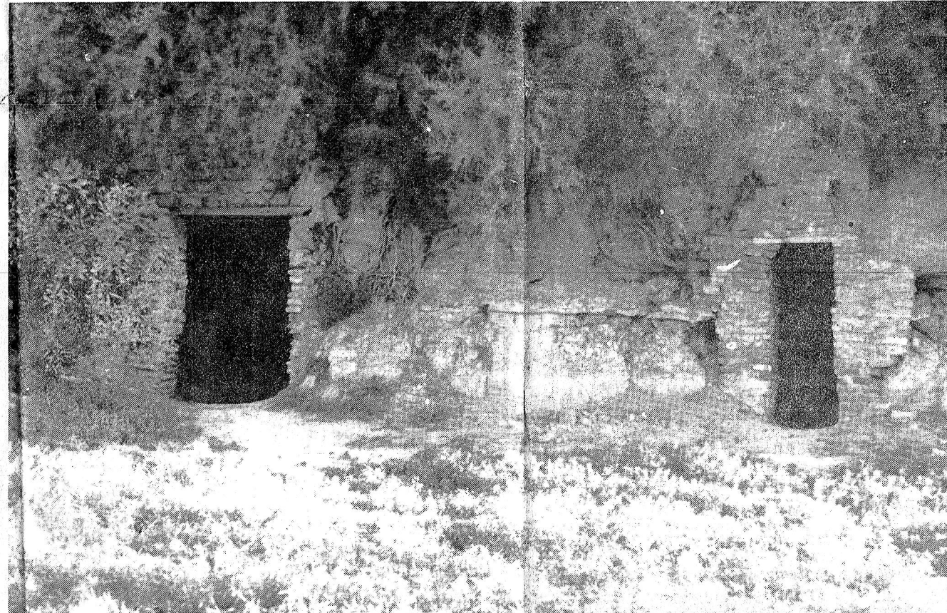
Las cuevas que aún se conservan. En ellas residían los corsarios y funcionaban los bodegones del puerto. Están excavadas en la tierra.