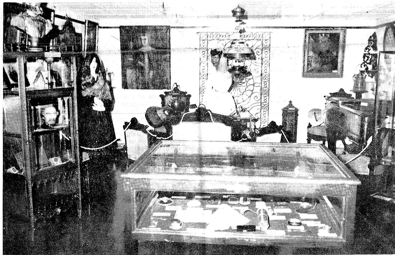
La "Sala Maragata", del Museo de Carmen de Patagones, donde se atesoran valiosos testimonios de un importante tramo de nuestra historia.