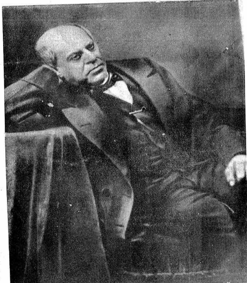
Retrato del año 1864, cuando era nuestro embajador en Estados Unidos.