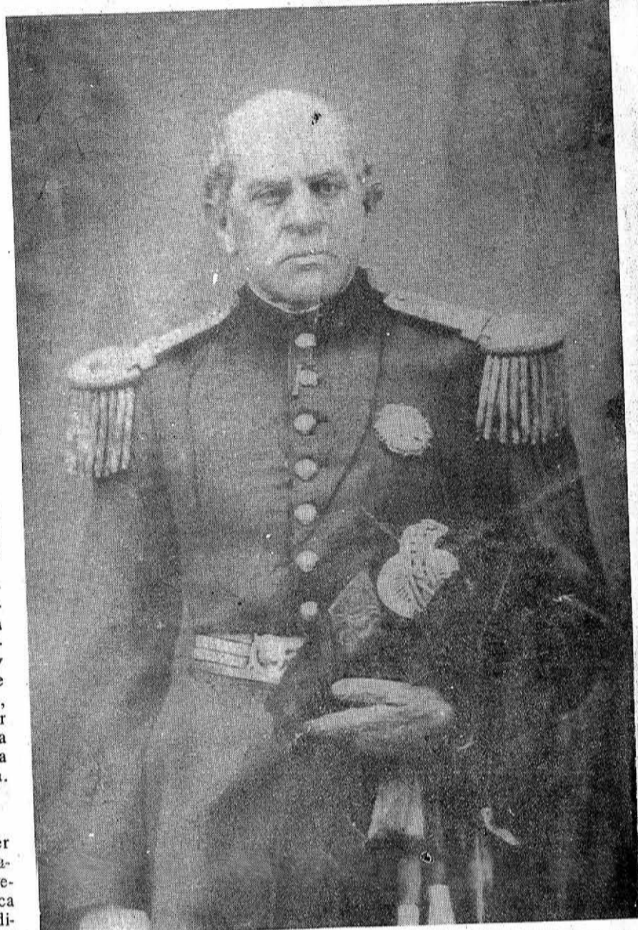
Con el uniforme de teniente coronel, en la batalla de Caseros, año 1852.

esta gente y, naturalmente conmovido, les pidió que hicieran silencio y habló, recordando sus días de maestro en Los Andes, lugar donde sufrió y fue feliz. Fue así que al terminar su improvisado discurso, expresó: "Dejad pues que vuelva a abrazar los majestuosos Andes abrumado, más que de años, de la gloria de haber merecido el bien de tres repúblicas y de los vecinos de Santa Rosa de los Andes, mi patria chilena". Poco después se dirigió, solo, hasta el cementerio local, donde colocó una corona en homenaje a amigos de la zona que habían fallecido.