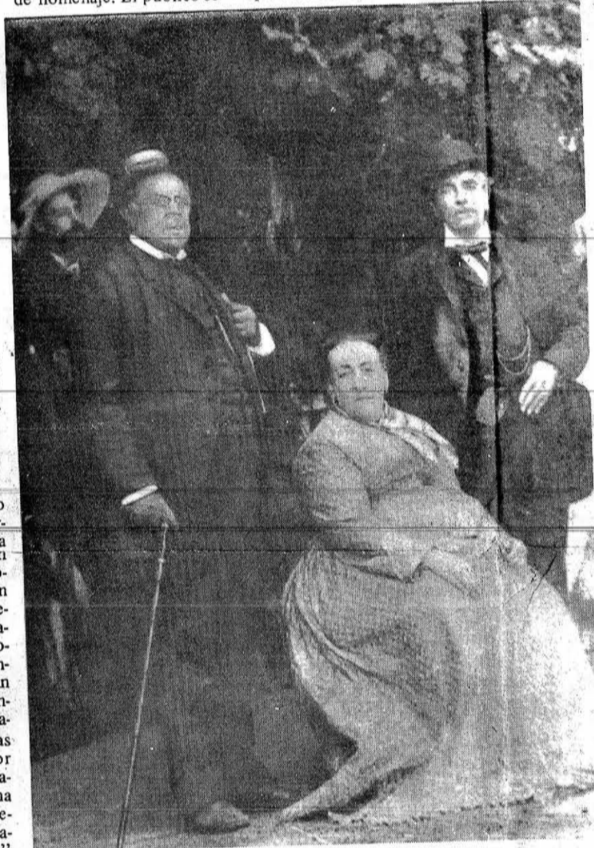
Foto de 1884, tomada en Chile, en la que se ve al ilustre sanjuanino con unos amigos. La imagen se conserva del Museo de la Casa de Sarmiento, en San Juan.