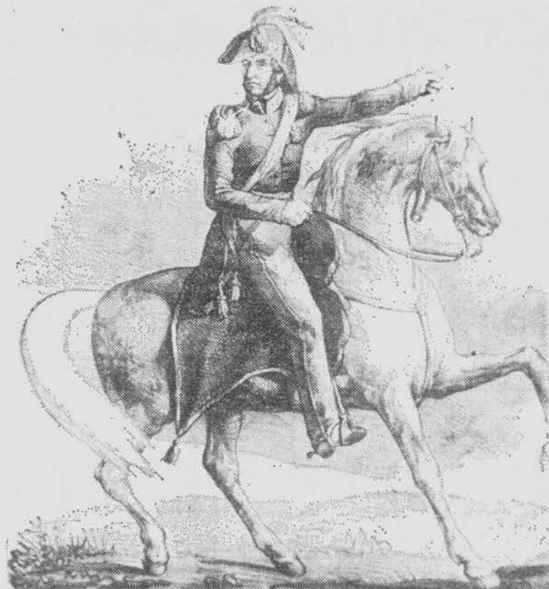
Litografía de San Martín, uno de los tres retratos que el artista francés Géricault hizo del vencedor de Maipo.

Prepara su expedición en Mendoza y allí construye el verdadero ejército de la Patria. Con in-